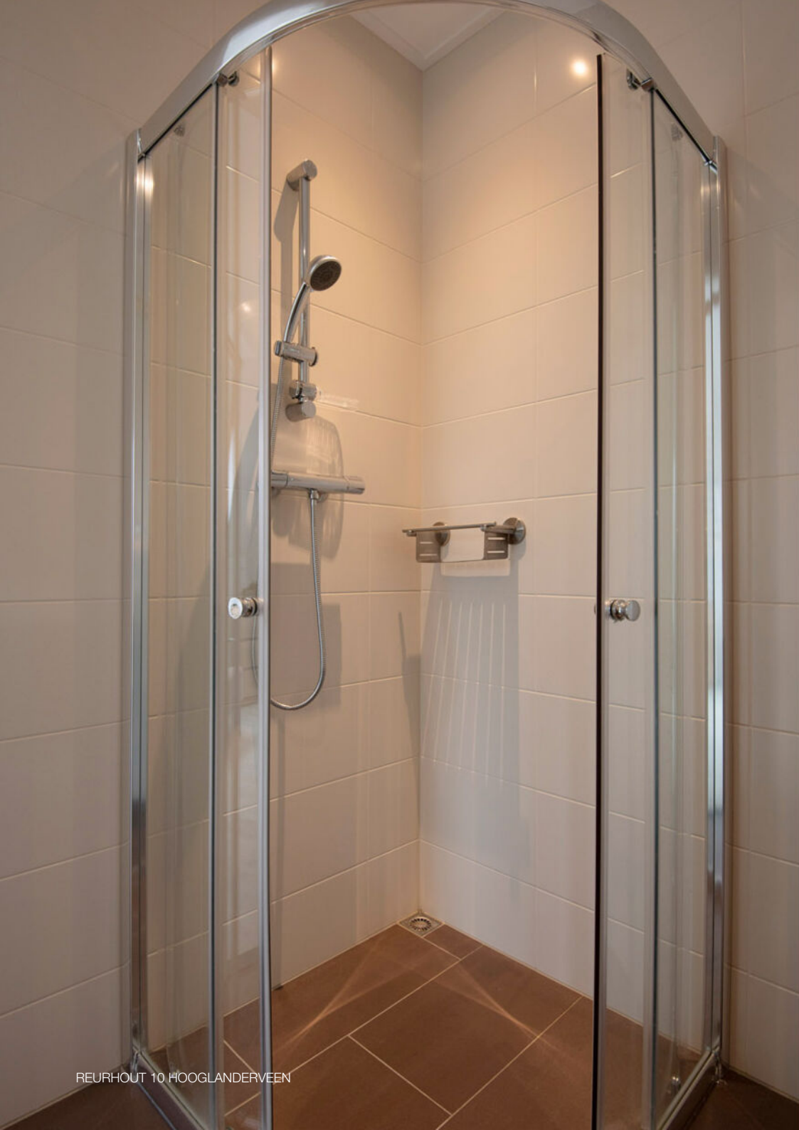
REURHOUT 10 HOOGLANDERVEEN