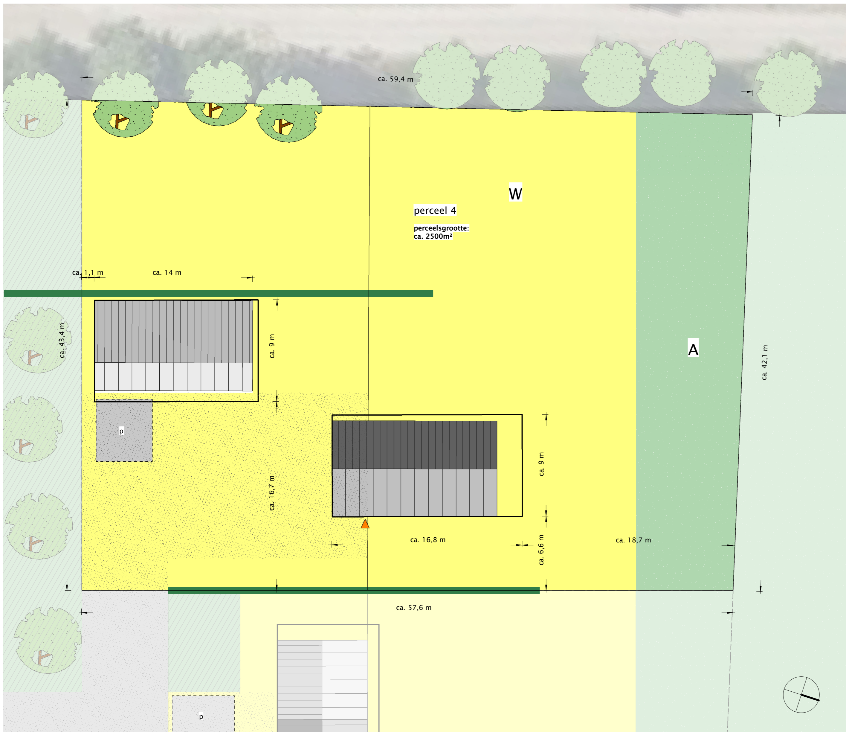
kavel perceel 4 1 : 200