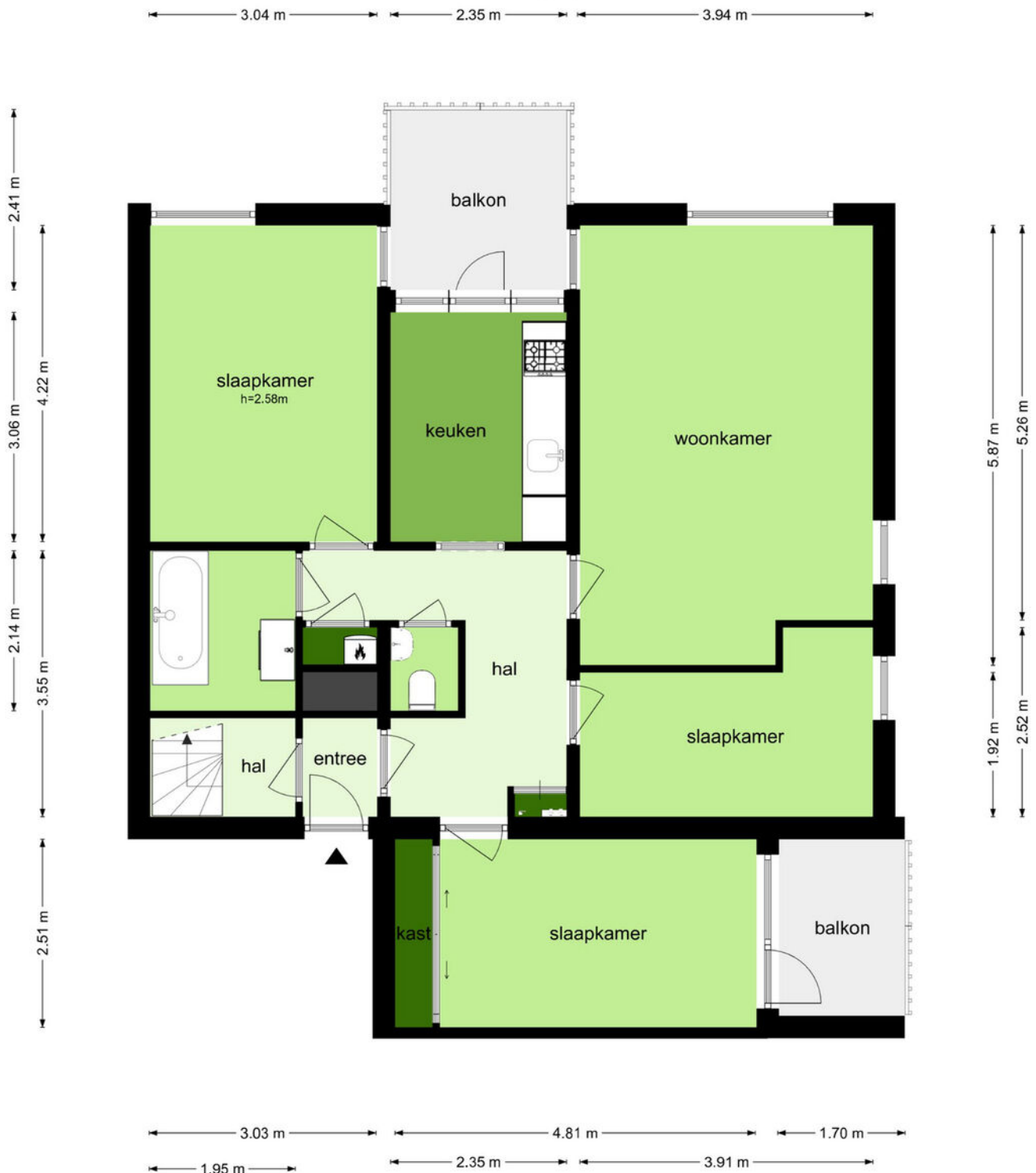
Hofmark 381 - Almere Eerste Verdieping

De plattegronden zijn geproduceerd voor promotionele doeleinden en ter indicatie. Aan de plattegronden kunnen geen rechten worden ontleend