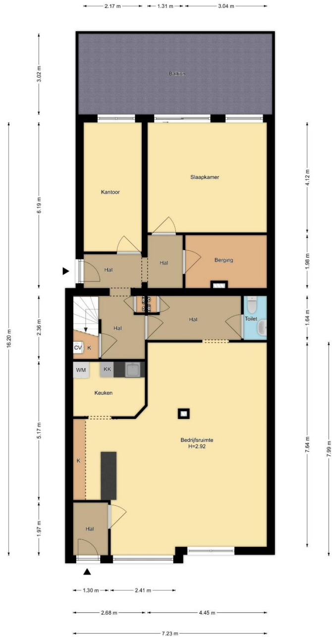
Begane Grond Zwanenburgerdijk 440, Zwanenburg