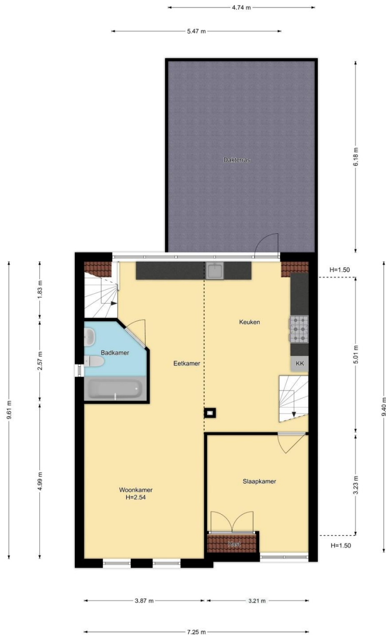
1e Verdieping Zwanenburgerdijk 440, Zwanenburg