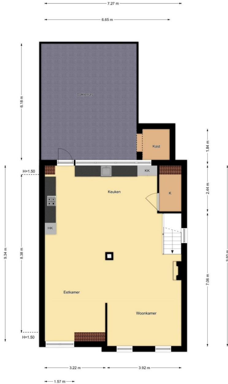
1e Verdieping Zwanenburgerdijk 439, Zwanenburg