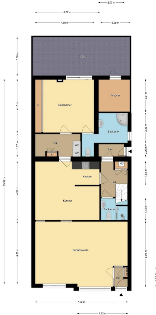
Begane Grond Zwanenburgerdijk 439, Zwanenburg