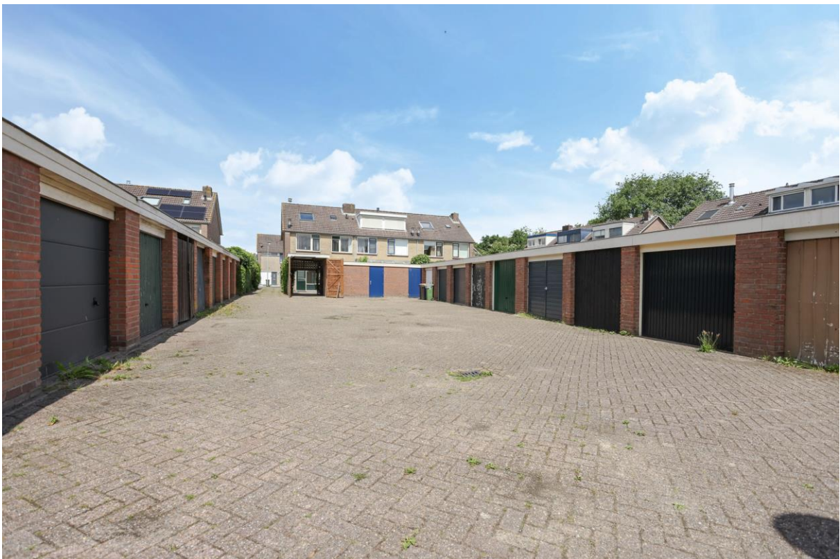
Garagebox Deliana van Weestraat 7N Achterveld