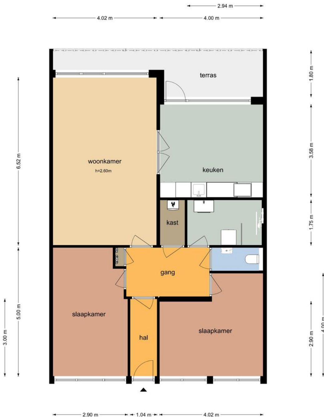
Alfred Nobellaan 665 - De Bilt Achtste Verdieping