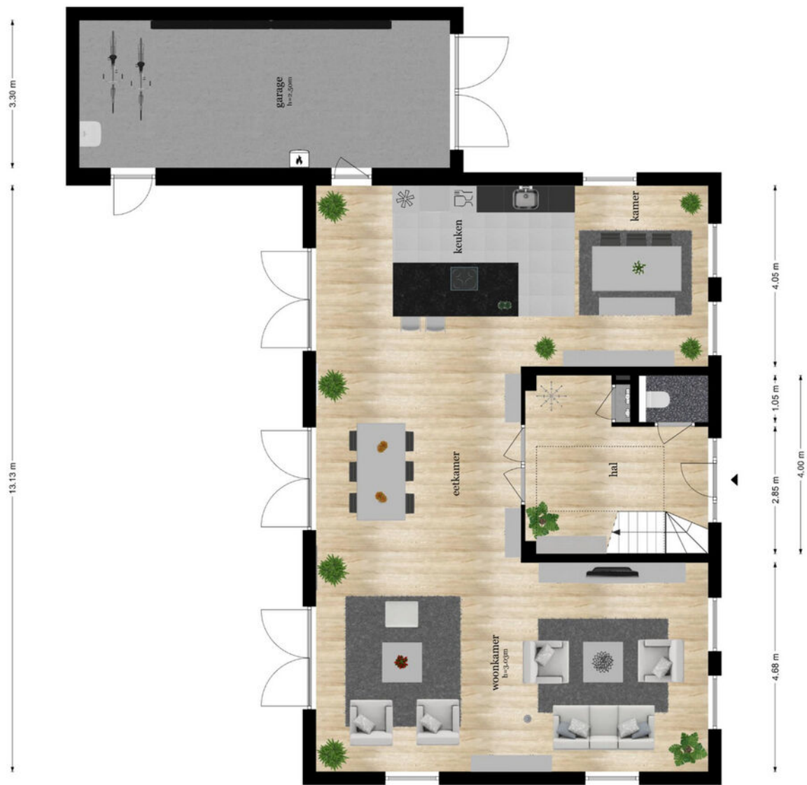
Tabakssteeg 3 - Leusden Begane Grond

De plattegronden zijn geproduceerd voor promotionele doeleinden en ter indicatie. Aan de plattegronden kunnen geen rechten worden ontleend.