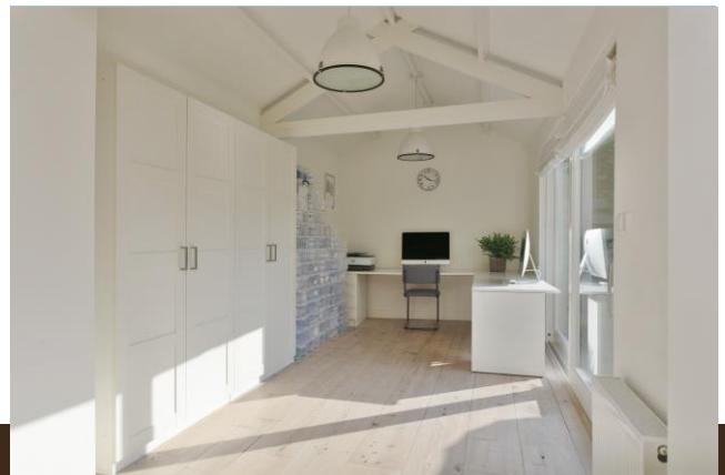
Leo Dongelmanstraat 1 Abcoude