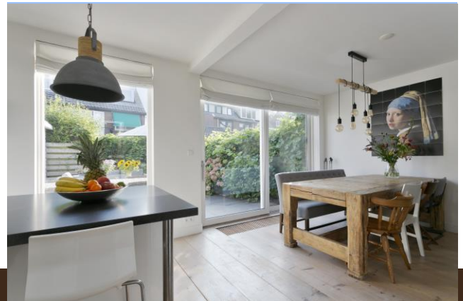
Leo Dongelmanstraat 1 Abcoude