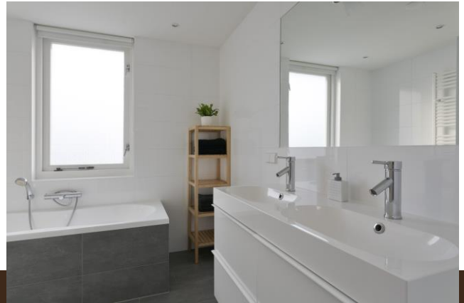
Leo Dongelmanstraat 1 Abcoude