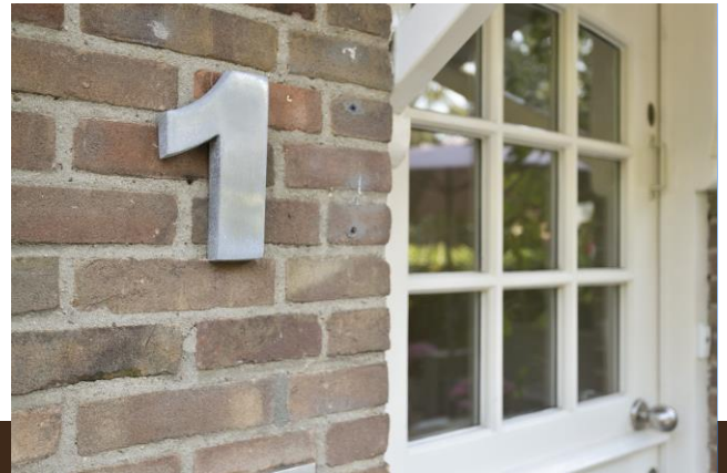
Leo Dongelmanstraat 1 Abcoude