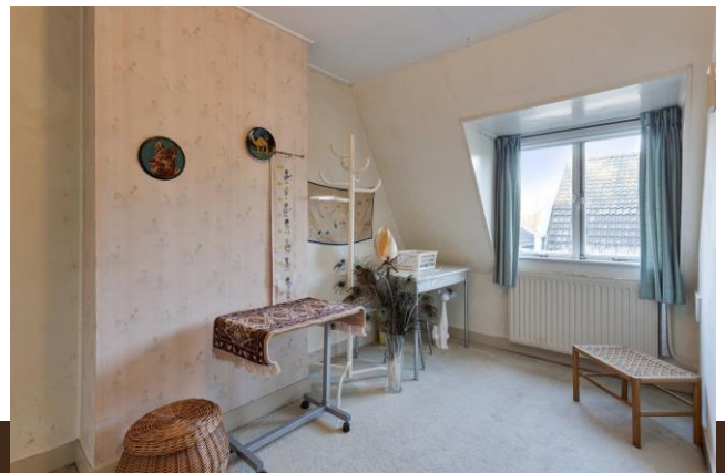
Stationsstraat 20 Abcoude