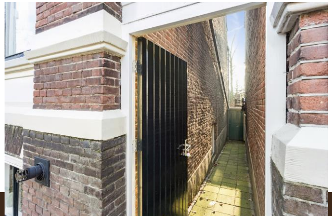
Stationsstraat 20 Abcoude