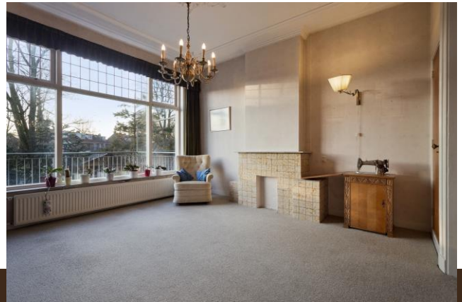
Stationsstraat 20 Abcoude