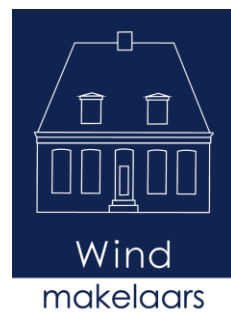
Dijkgraaf 311 - Oudekerk aan de Amstel