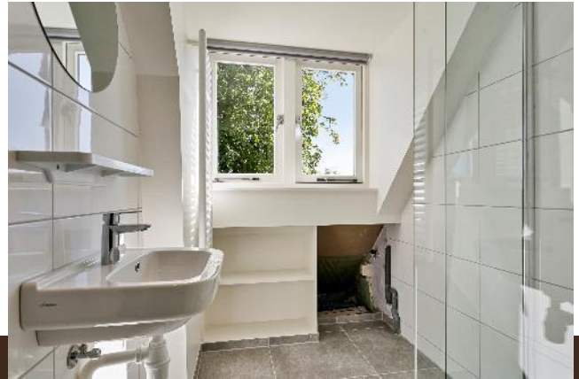
Gein Noord 17 Abcoude