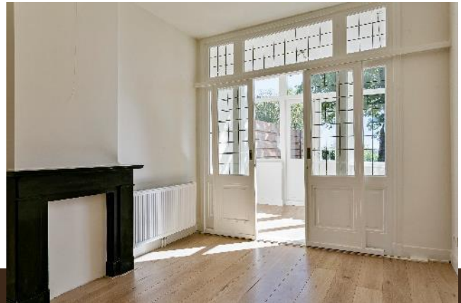
Gein Noord 17 Abcoude