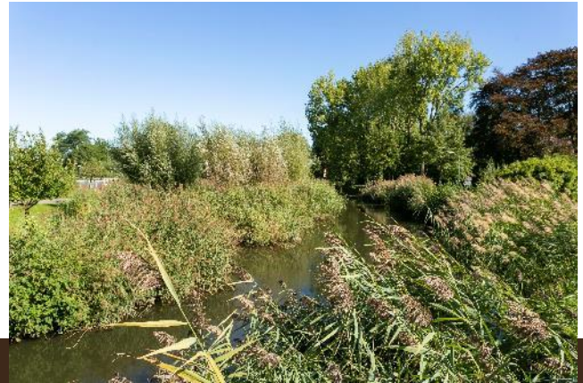
Gein Noord 17 Abcoude