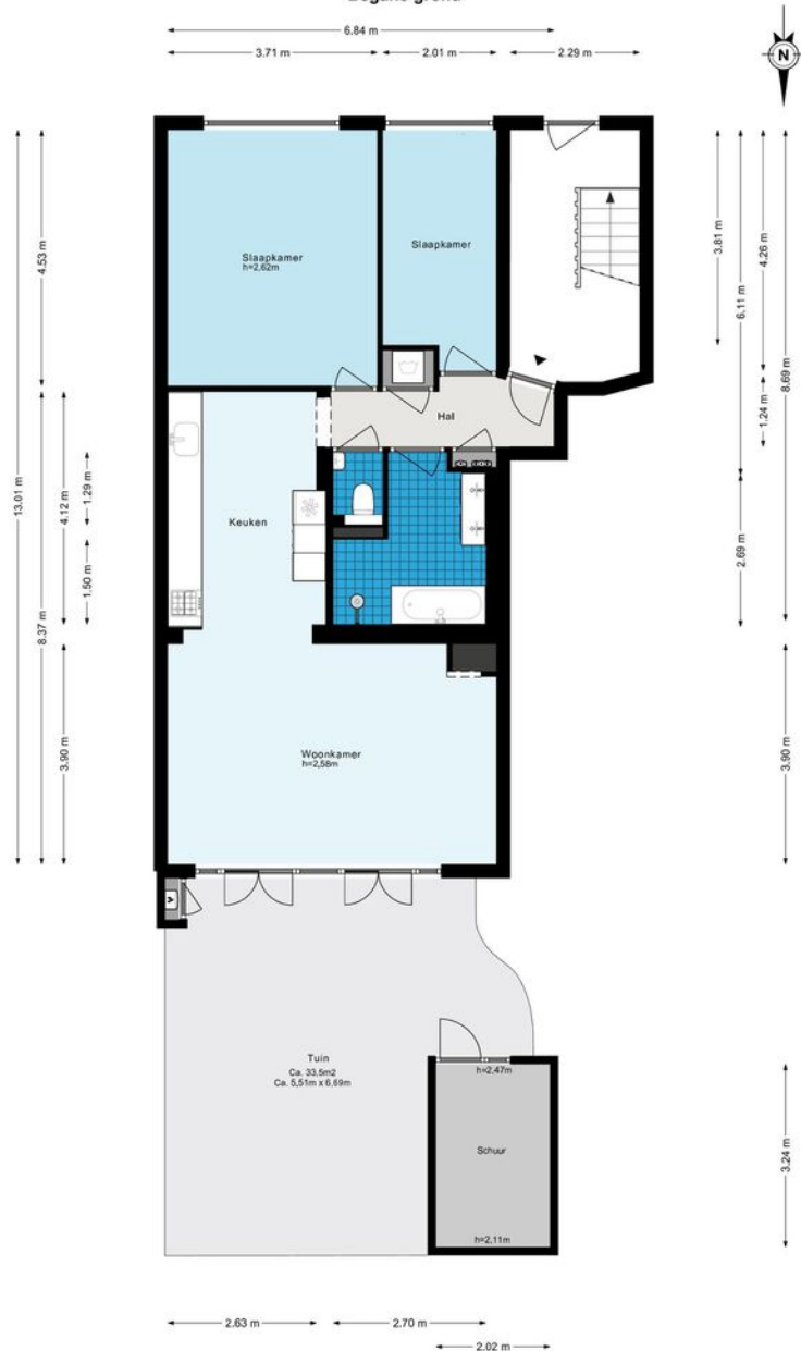
Postjeskade 6H - Amsterdam Begane grond