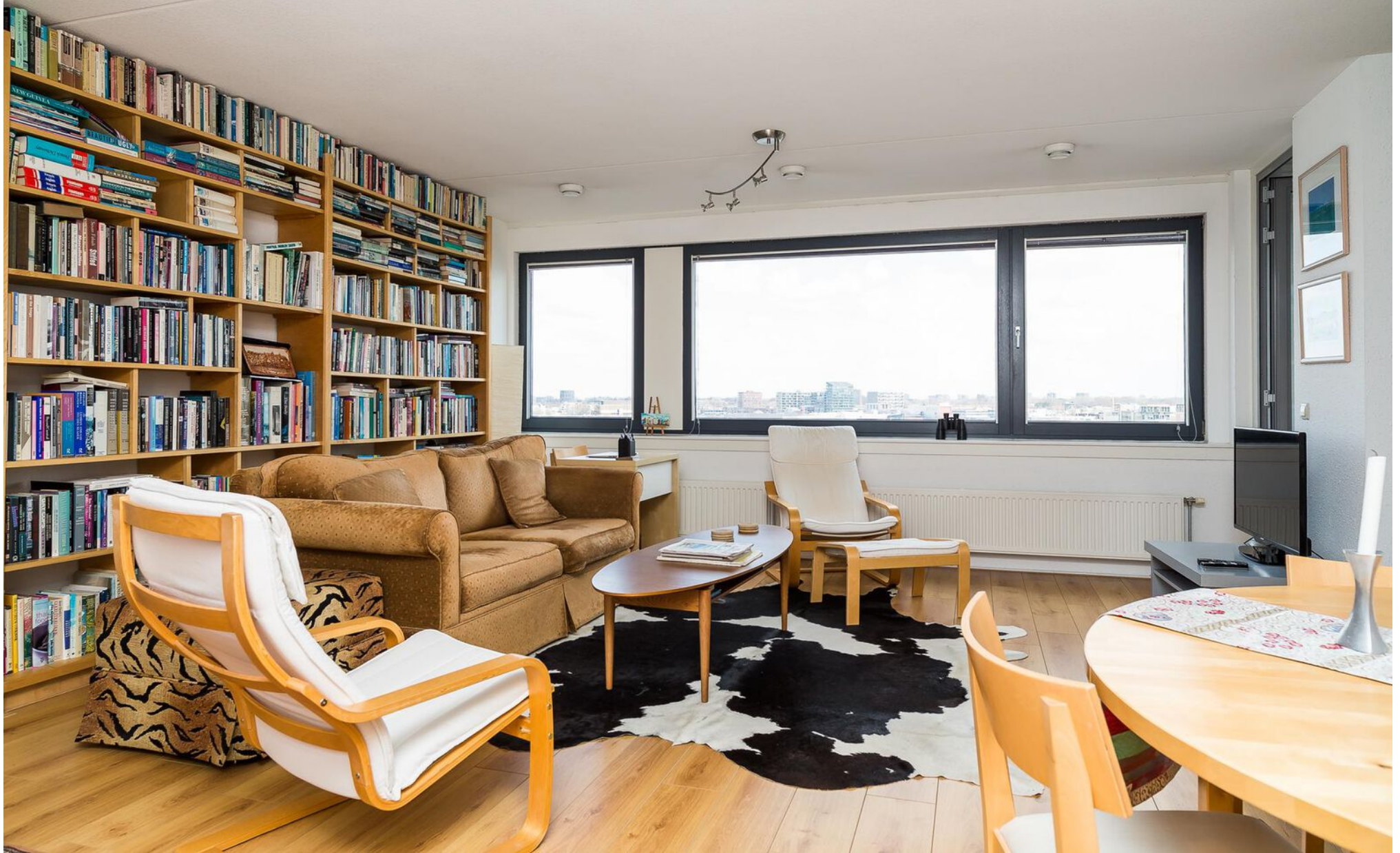
Ruim opgezette woonkamer.