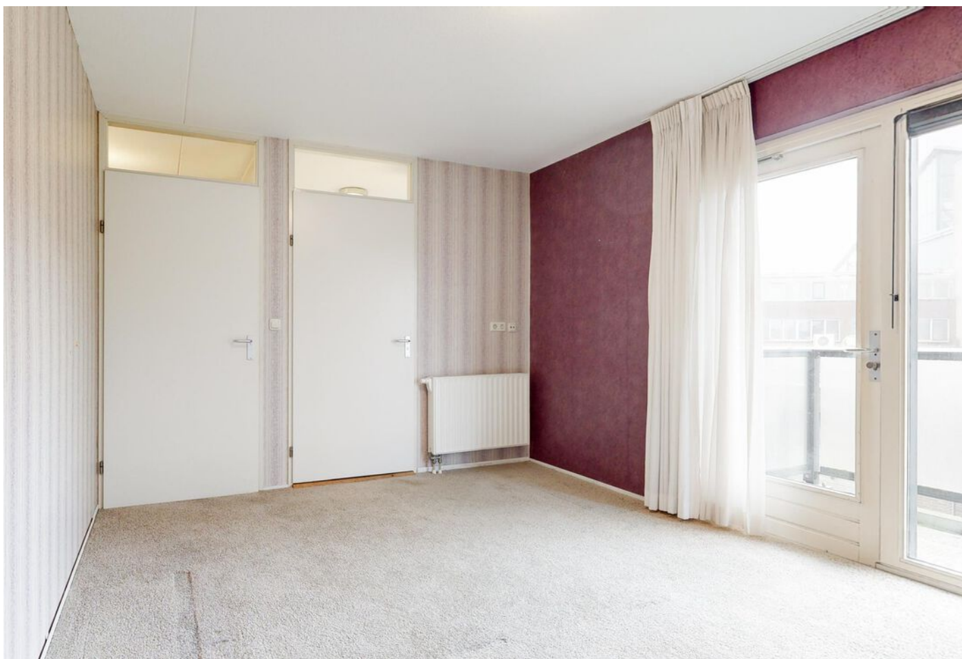
Rigtershof 6, Grootebroek