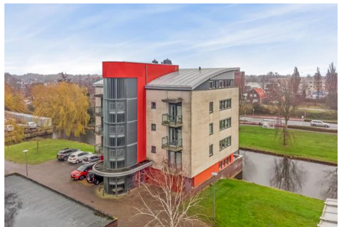
Rigtershof 6, Grootebroek