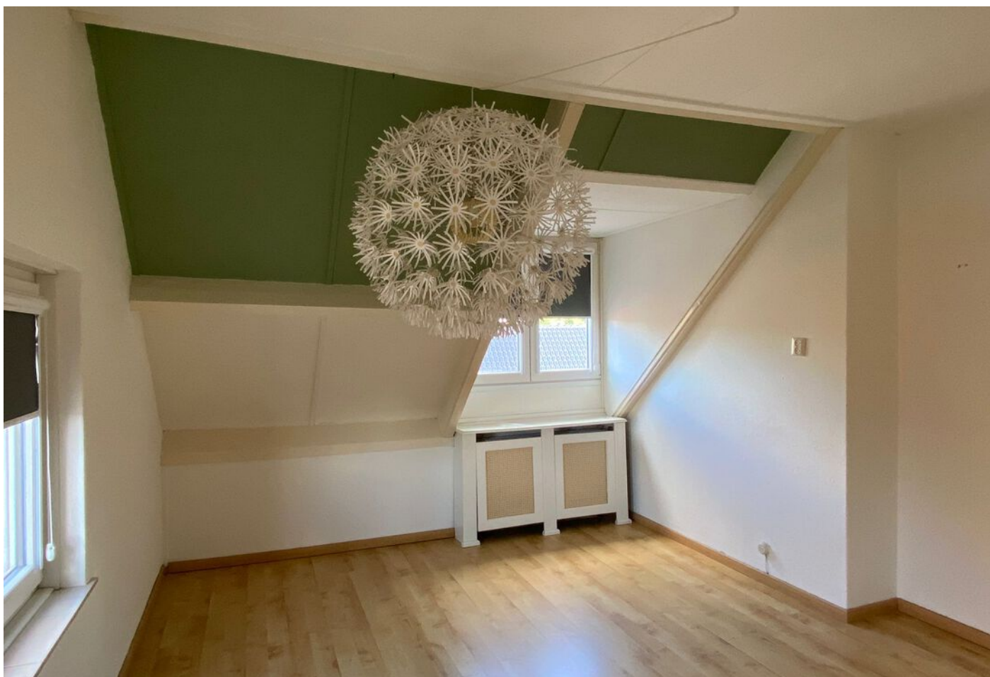
Oostersingel 9 b, Medemblik