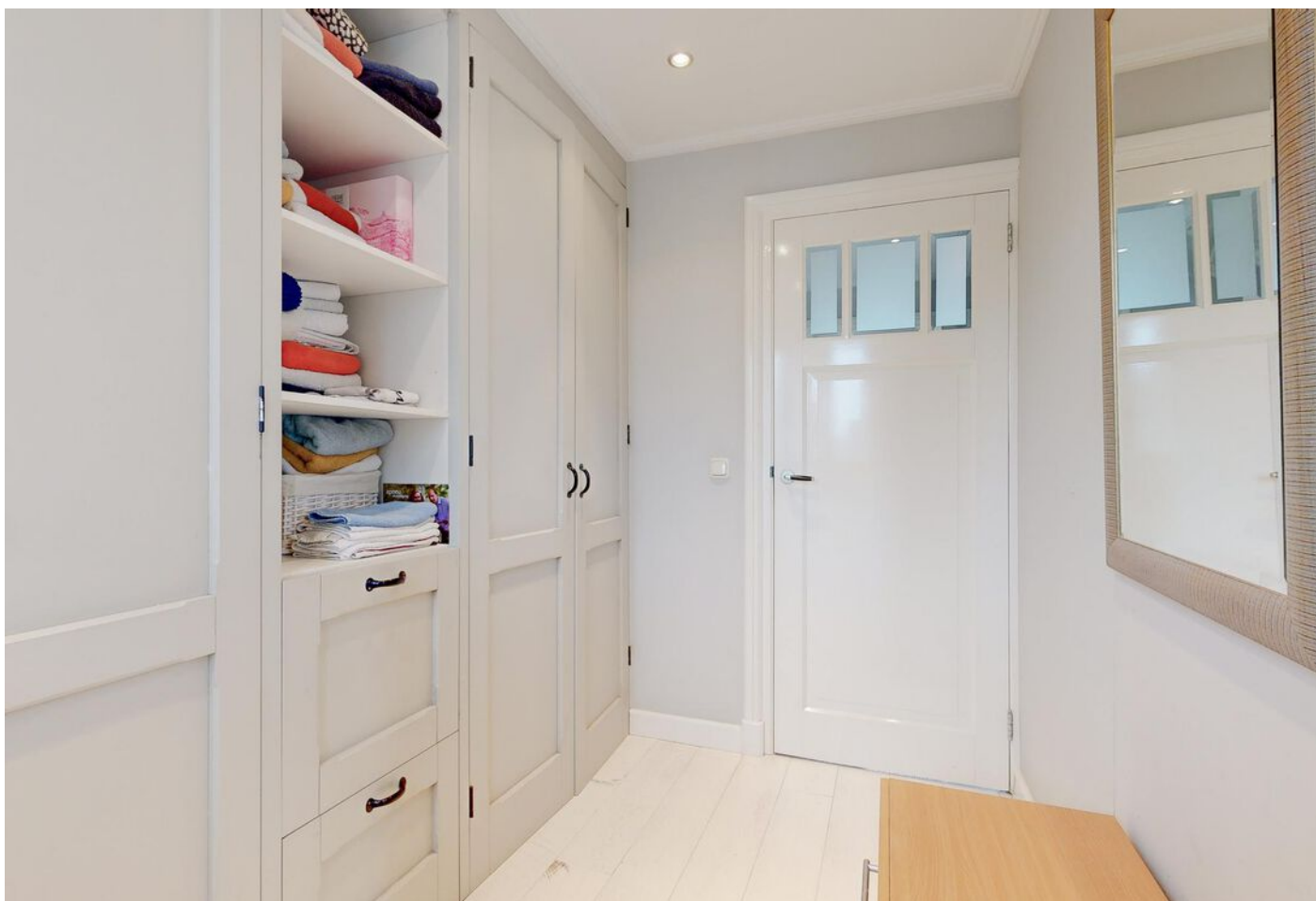
Simon Koopmanstraat 109, Wervershoof