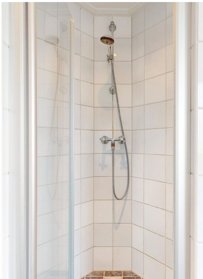
Simon Koopmanstraat 109, Wervershoof