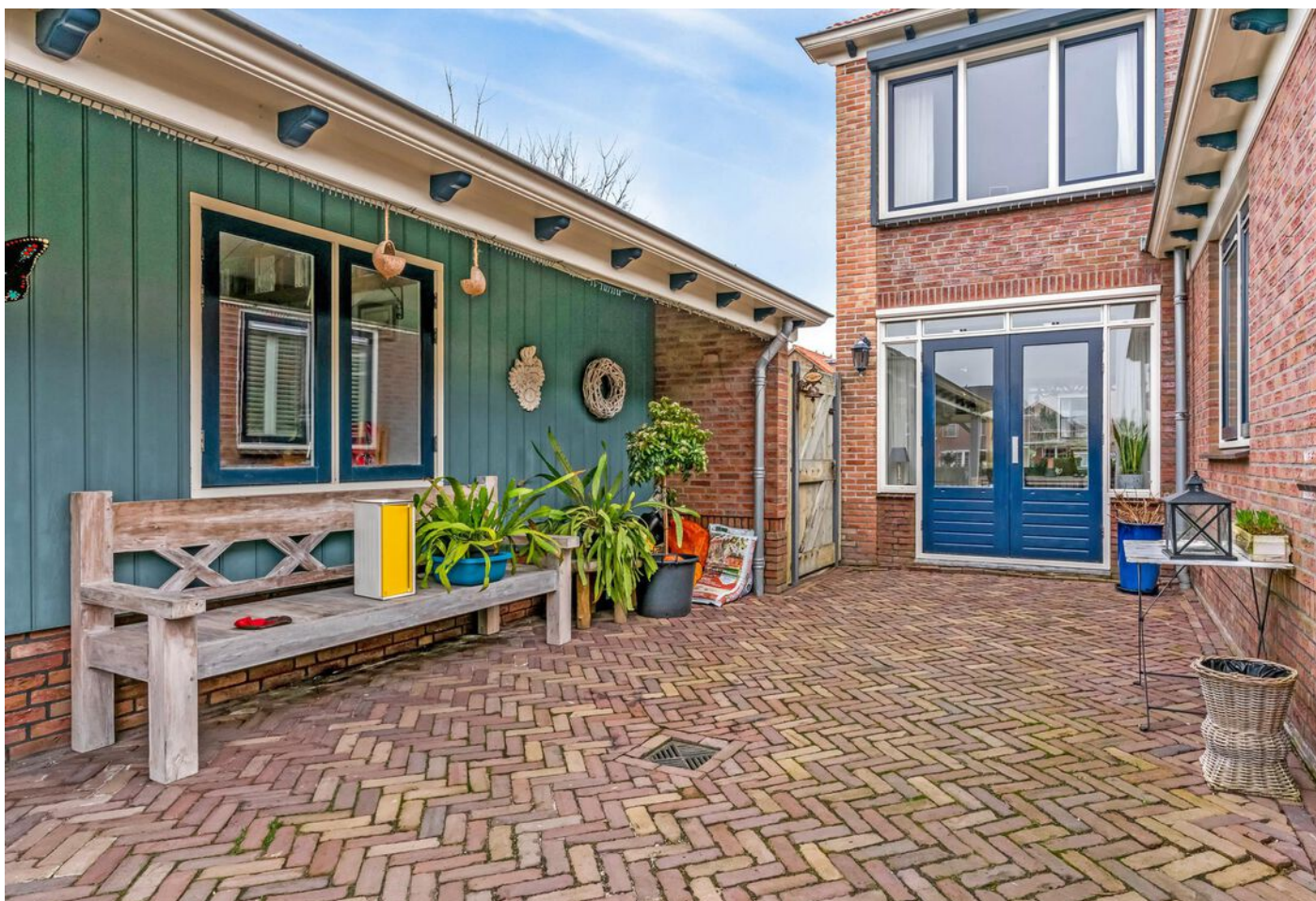
Simon Koopmanstraat 109, Wervershoof