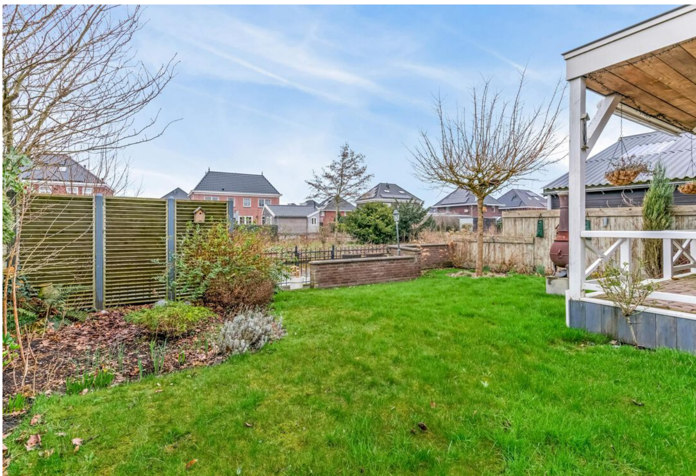
Simon Koopmanstraat 109, Wervershoof