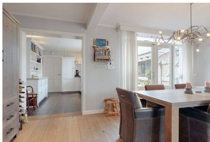
Simon Koopmanstraat 109, Wervershoof