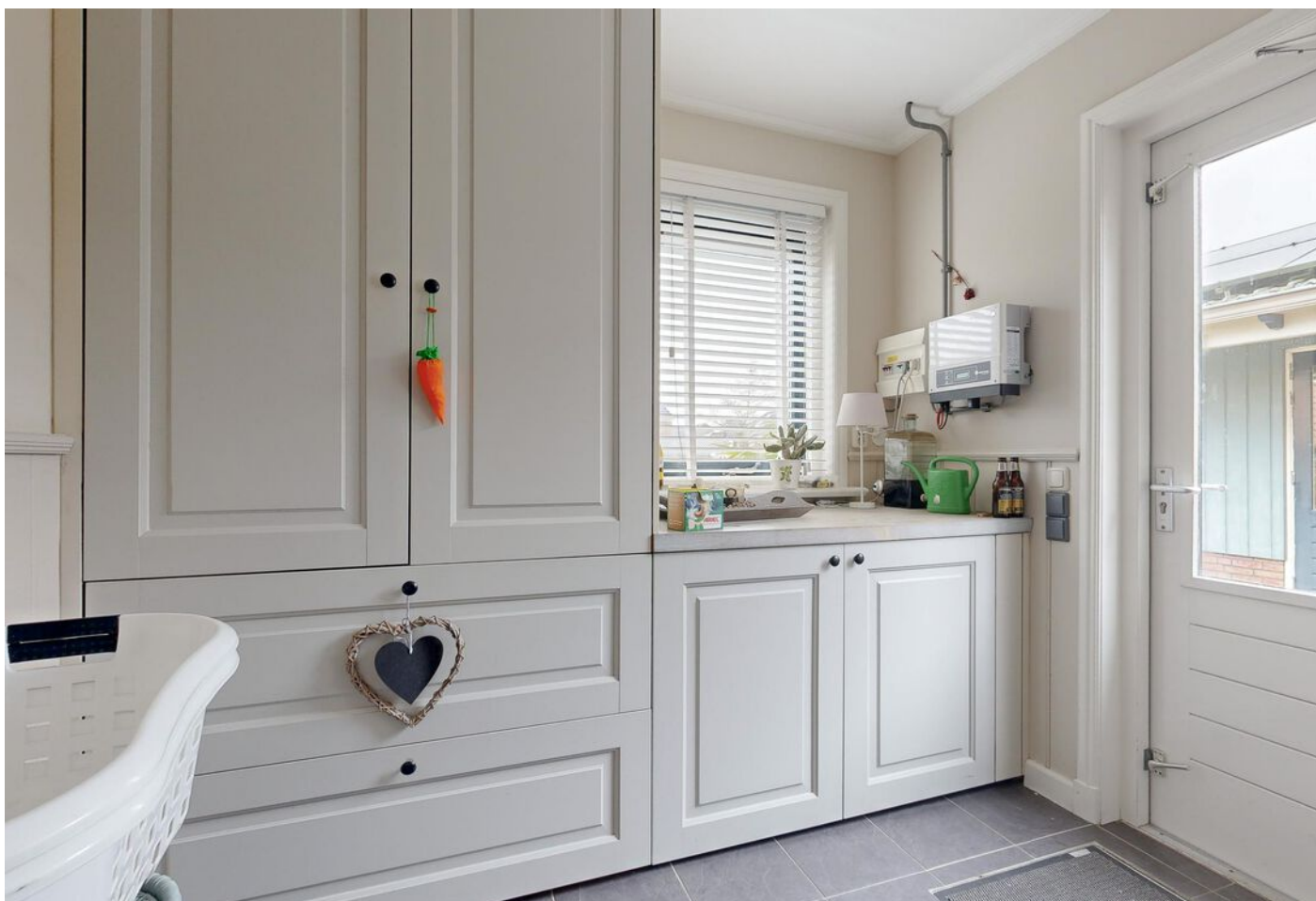
Simon Koopmanstraat 109, Wervershoof