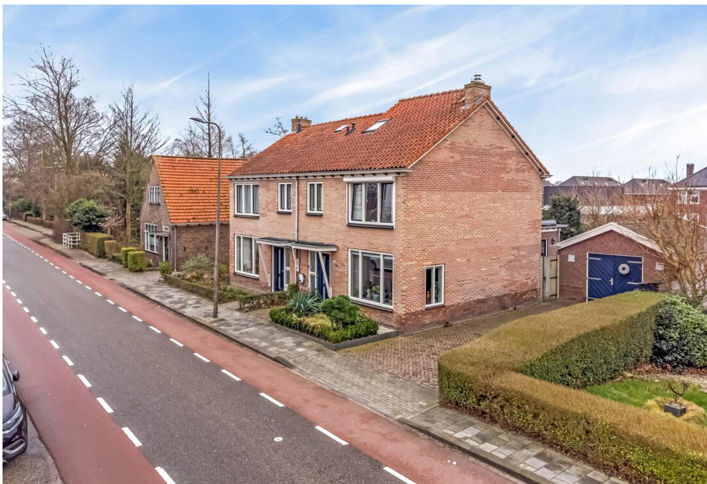
Simon Koopmanstraat 109, Wervershoof