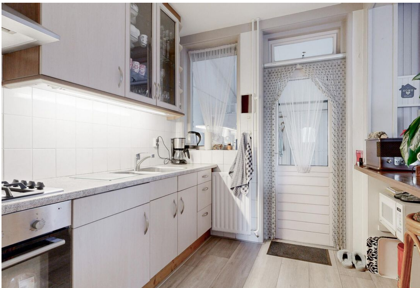
Simon Koopmanstraat 204, Wervershoof