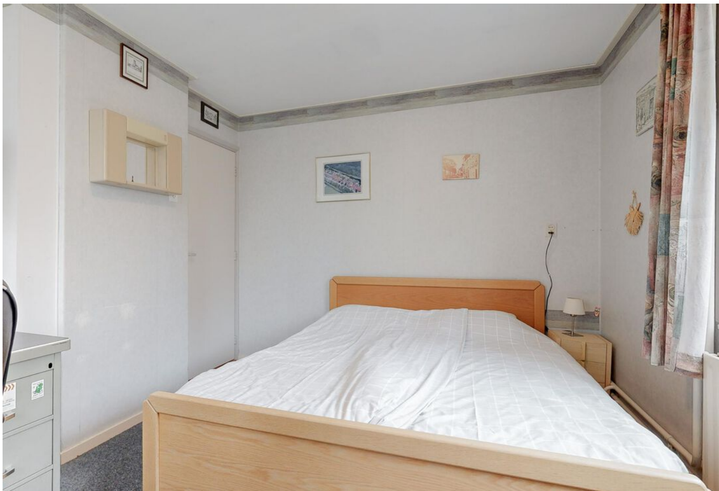
Simon Koopmanstraat 204, Wervershoof