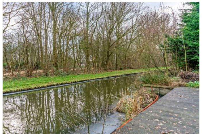
Simon Koopmanstraat 204, Wervershoof