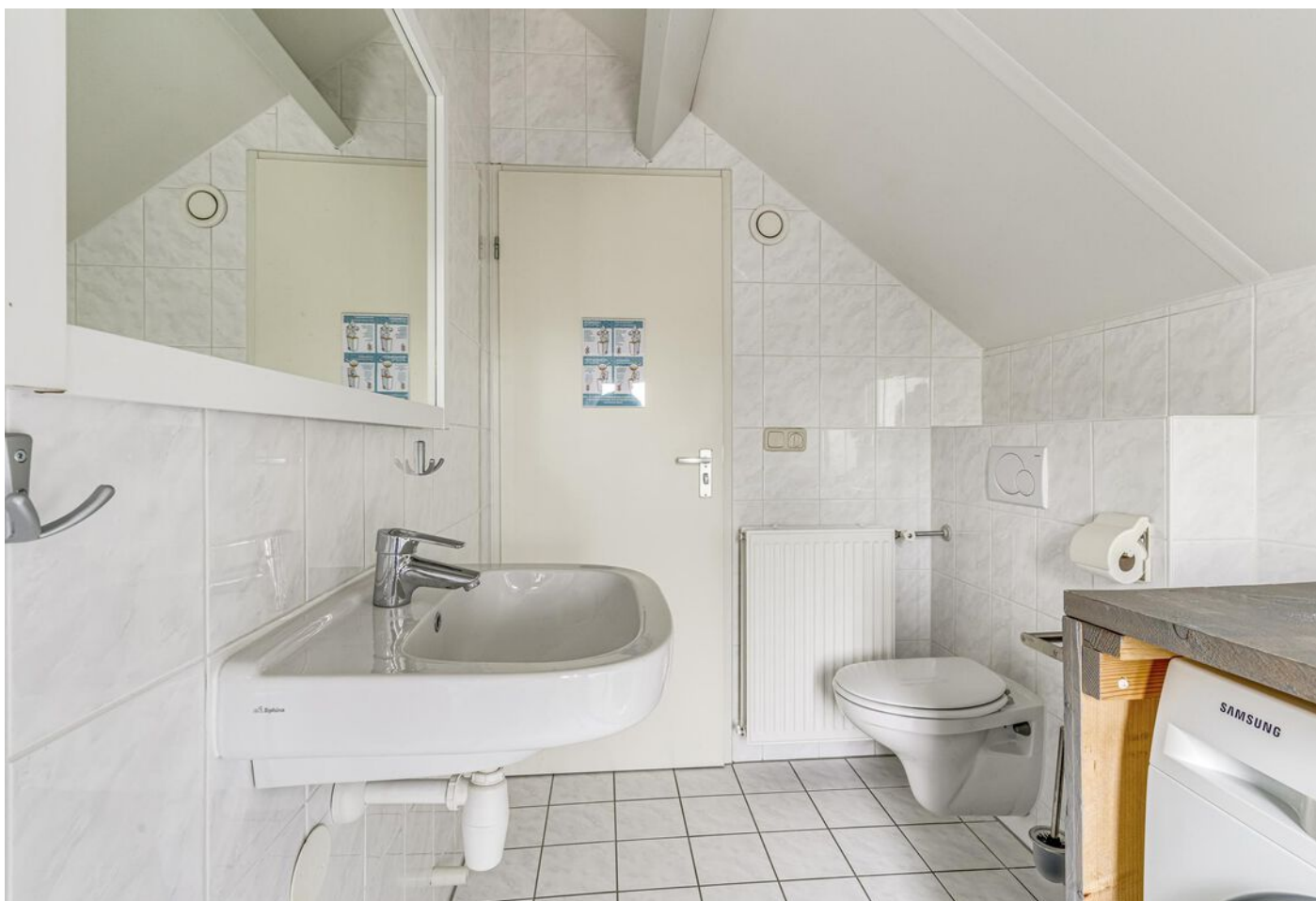
Onderdijk 245 098, Wervershoof