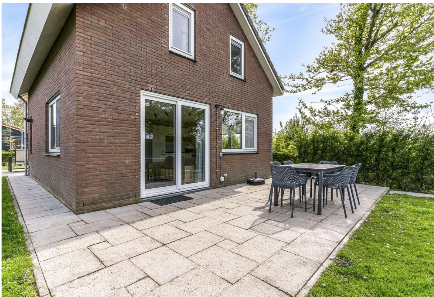
Onderdijk 245 098, Wervershoof