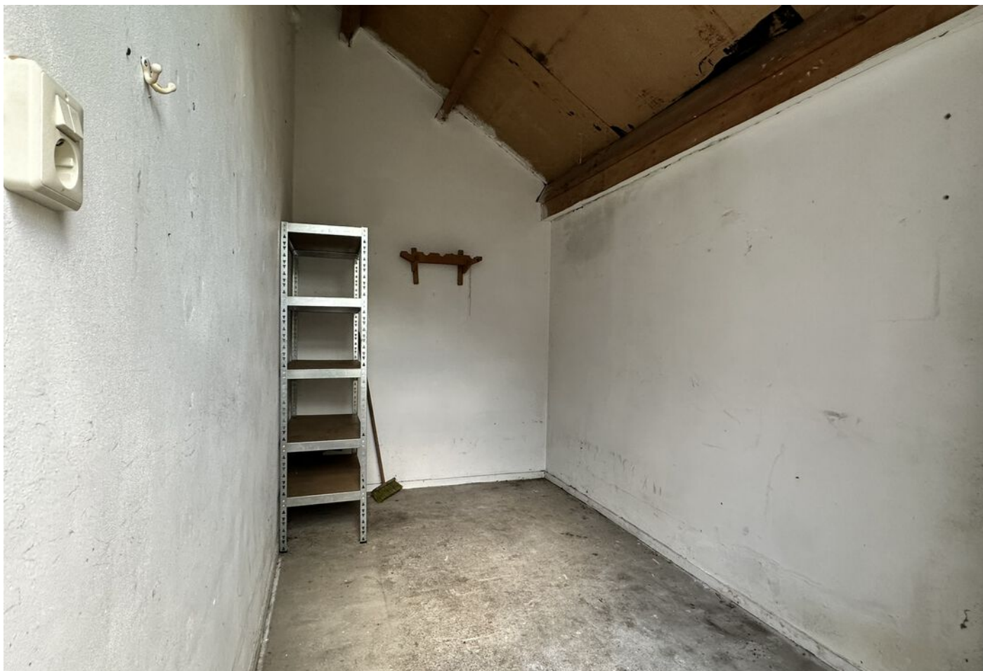
Pieter Wariuslaan 72, Midwoud