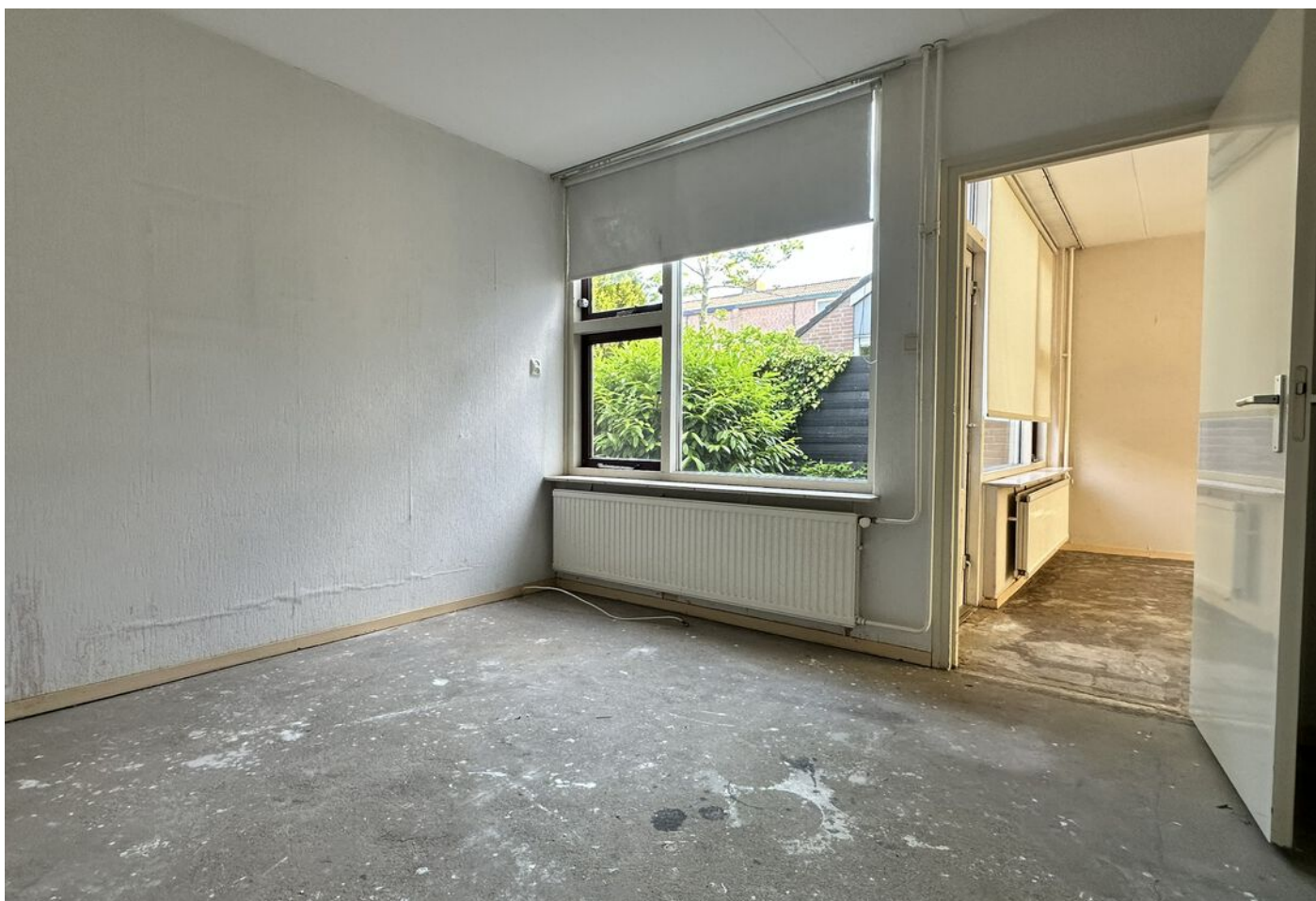
Pieter Wariuslaan 72, Midwoud