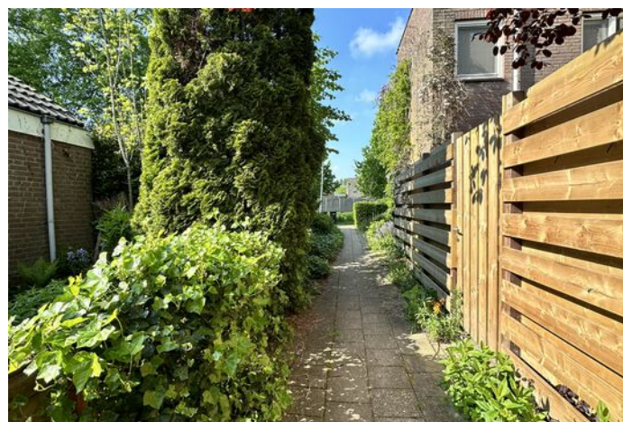
Pieter Wariuslaan 72, Midwoud