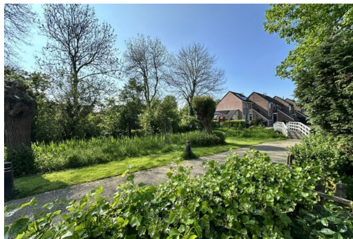
Pieter Wariuslaan 72, Midwoud