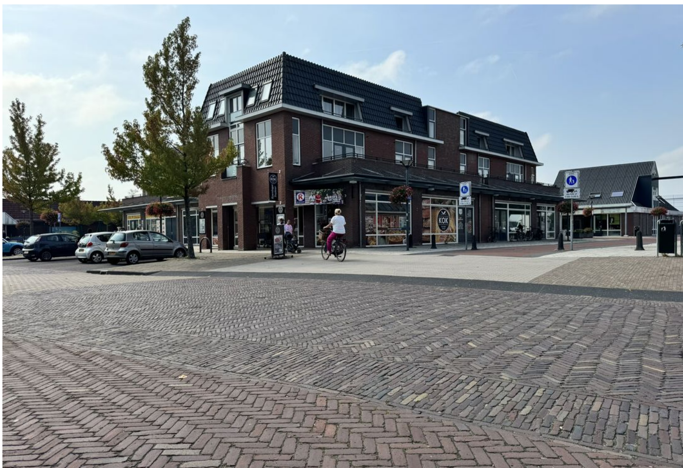
Lindenlaan 30, Wognum