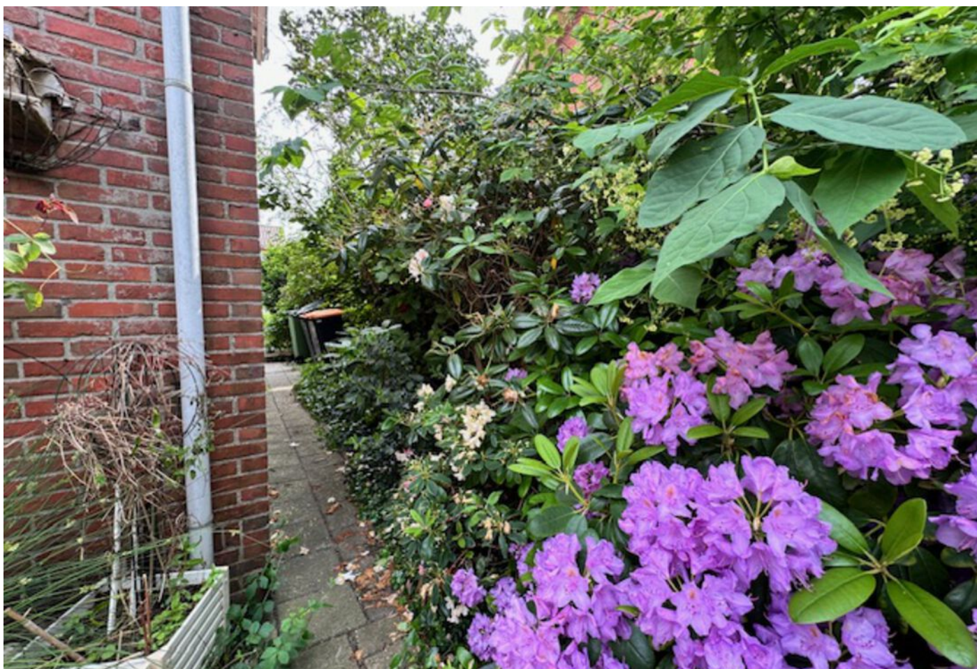
Lindenlaan 30, Wognum