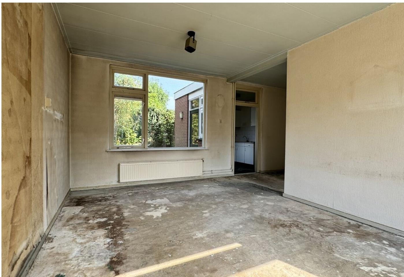
Lindenlaan 30, Wognum