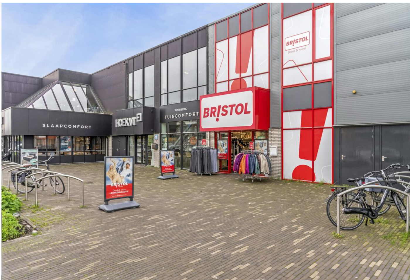
Burgemeester Boonlaan 2, Bovenkarspel