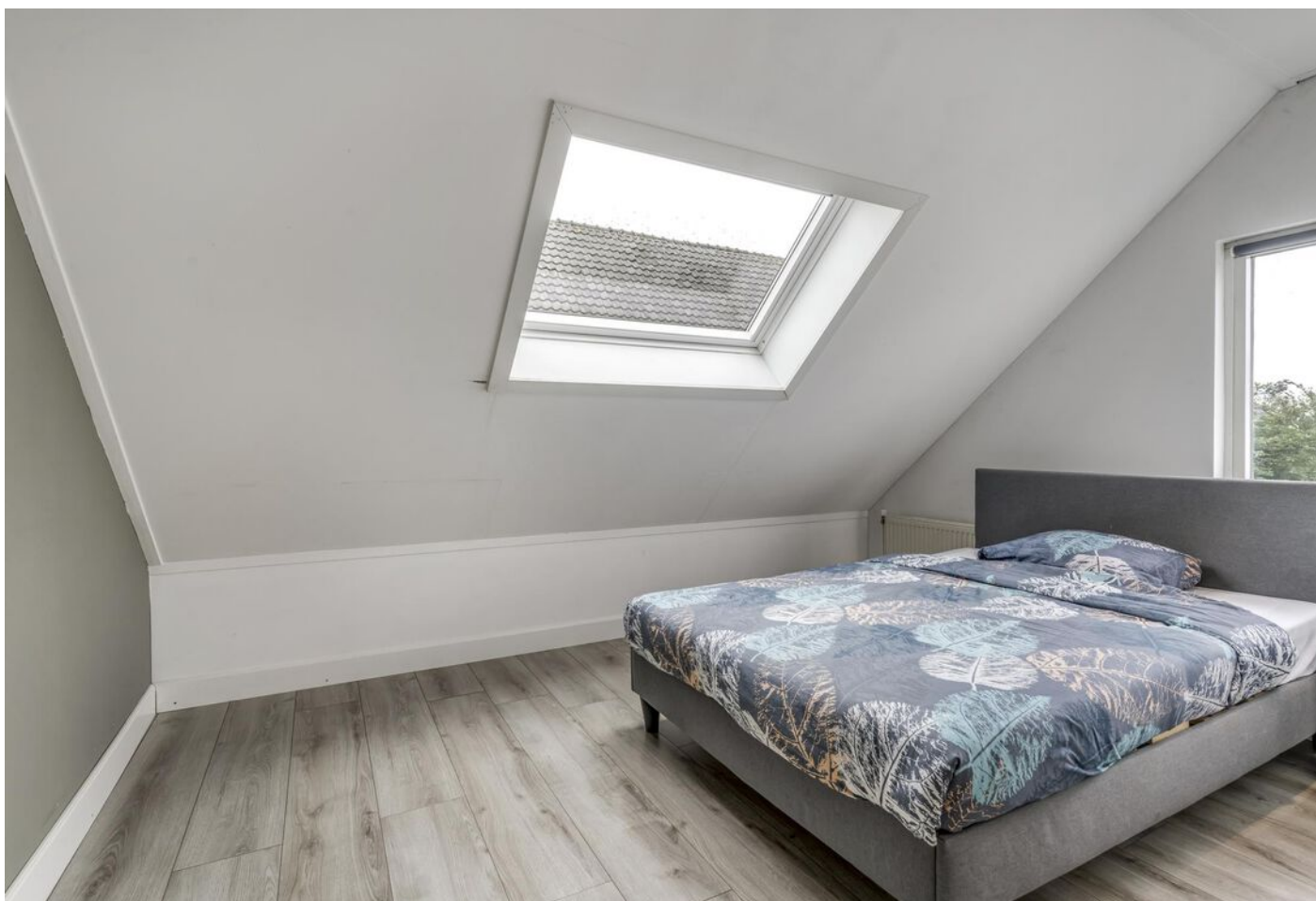
Burgemeester Boonlaan 2, Bovenkarspel