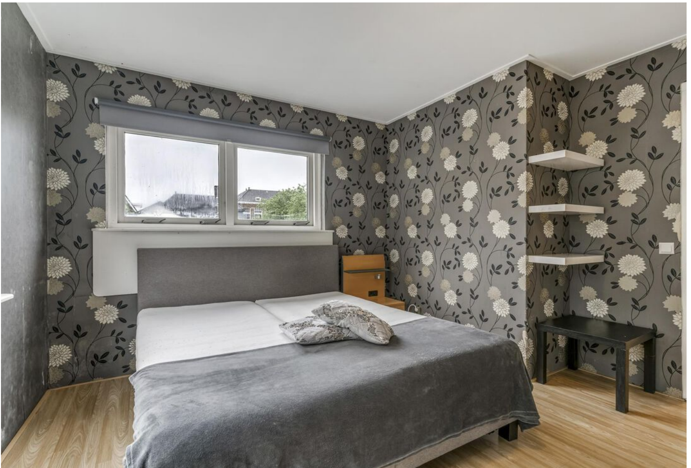
Burgemeester Boonlaan 2, Bovenkarspel