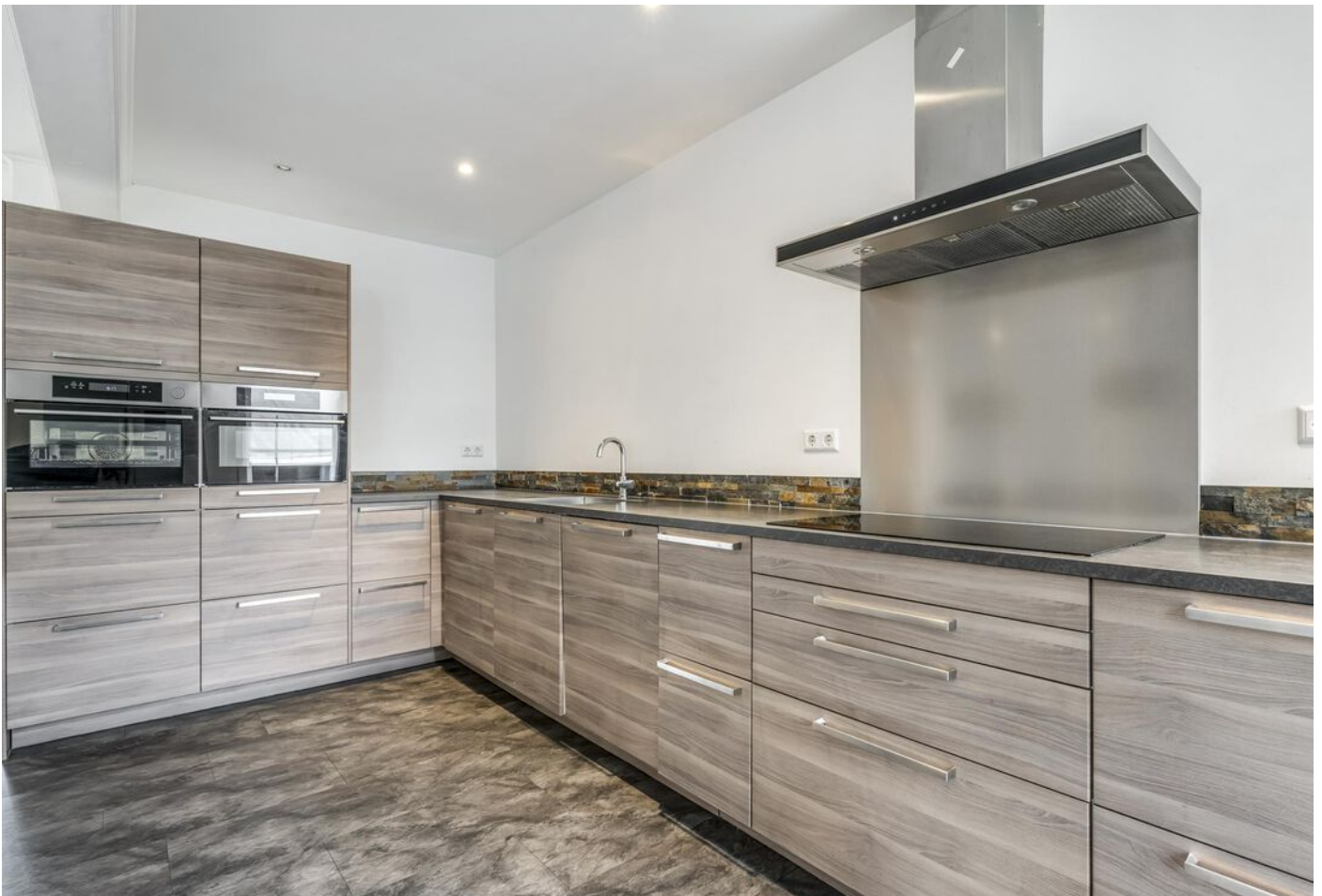
Burgemeester Boonlaan 2, Bovenkarspel