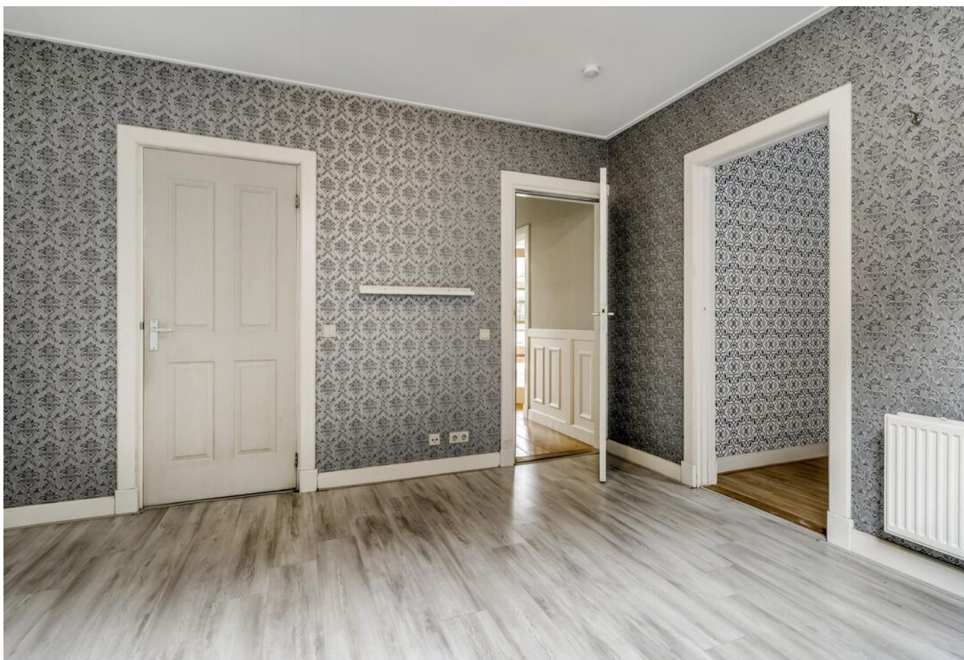
Burgemeester Boonlaan 2, Bovenkarspel