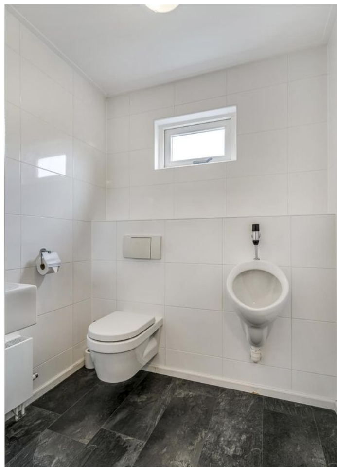
Burgemeester Boonlaan 2, Bovenkarspel