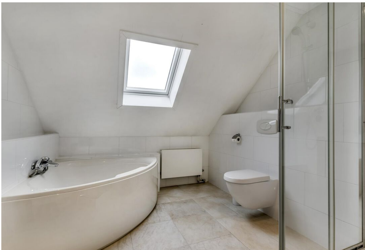
Burgemeester Boonlaan 2, Bovenkarspel