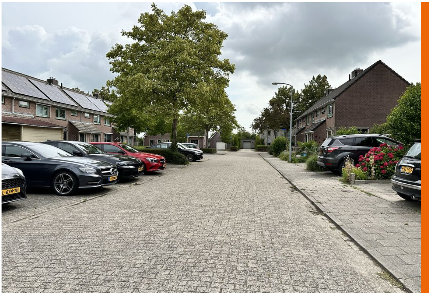
Wijzendhoek 15, Nibbixwoud