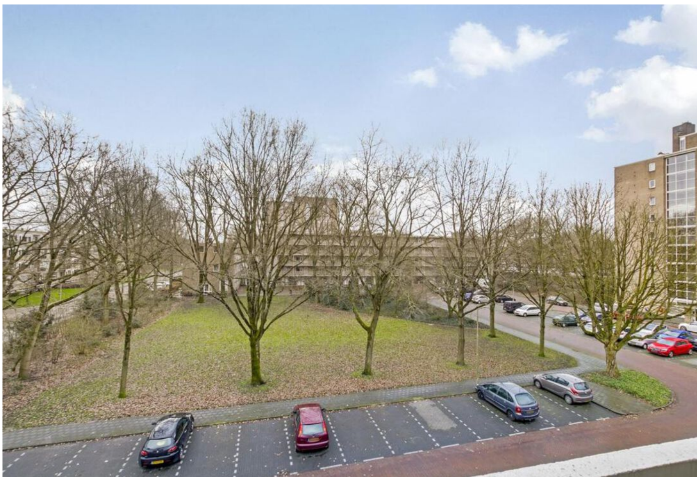
Populierenlaan 399, Amstelveen