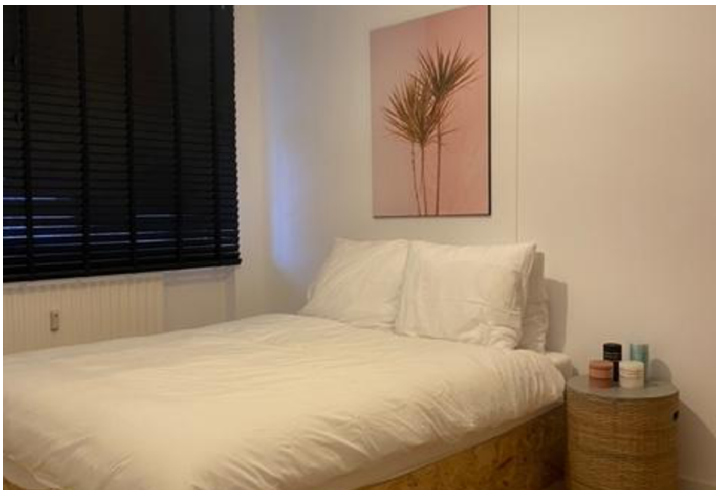
Populierenlaan 399, Amstelveen