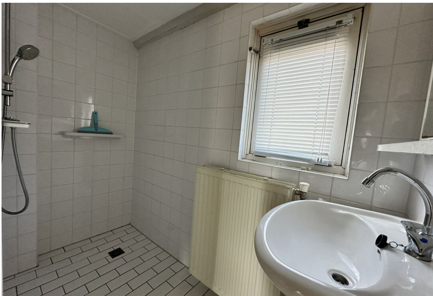
Lindenlaan 19, Wognum