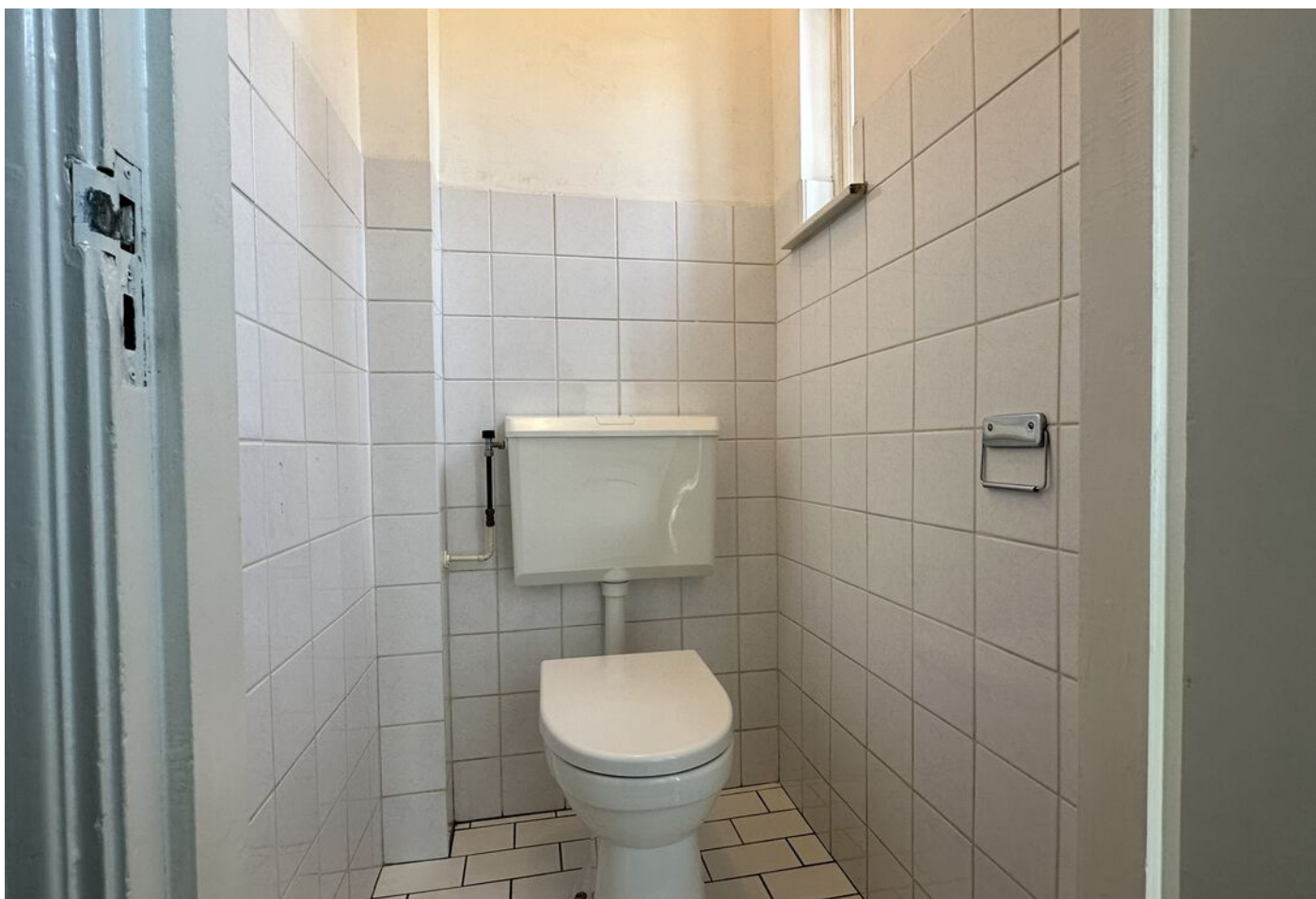
Lindenlaan 19, Wognum