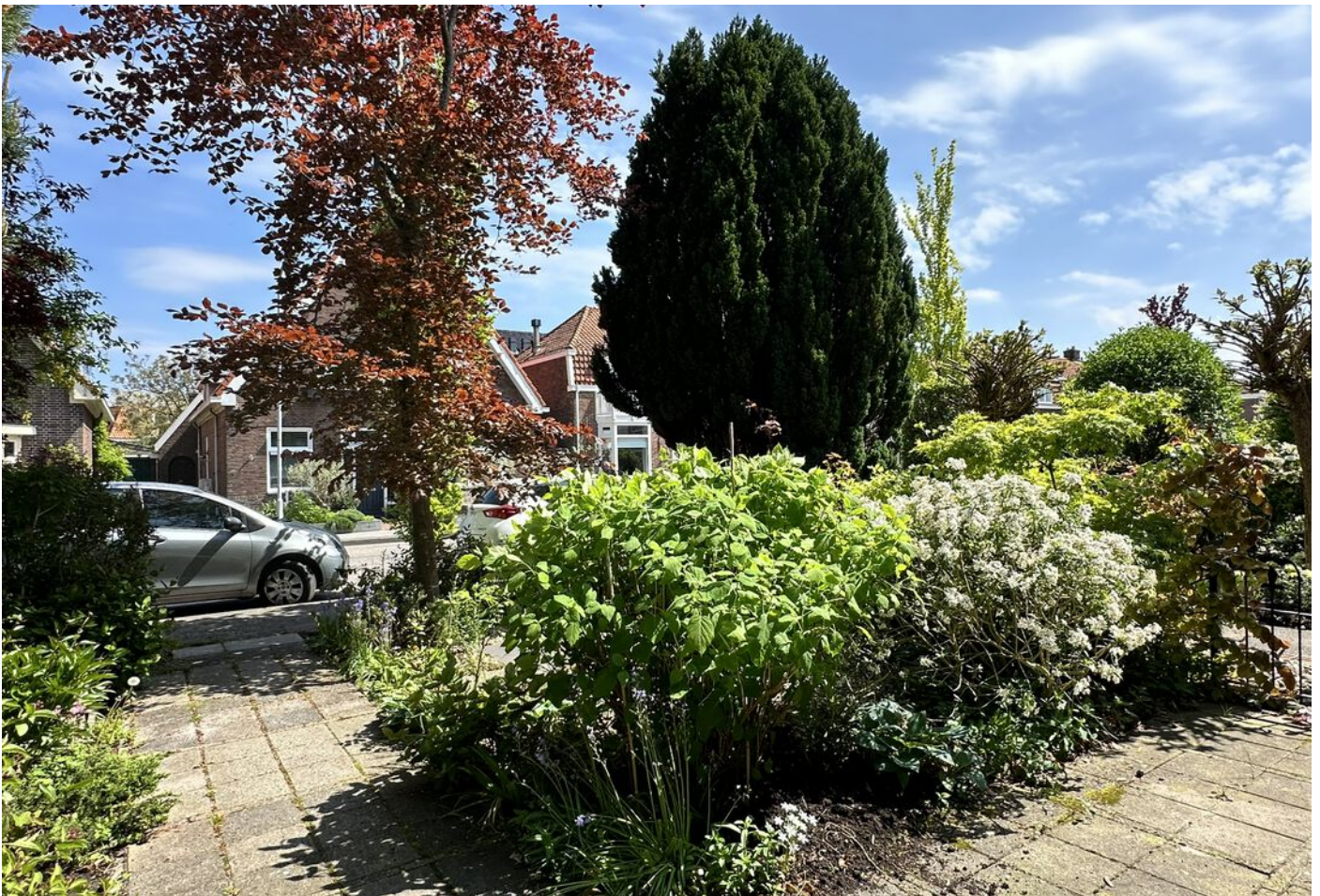
Meerlaan 31, Medemblik