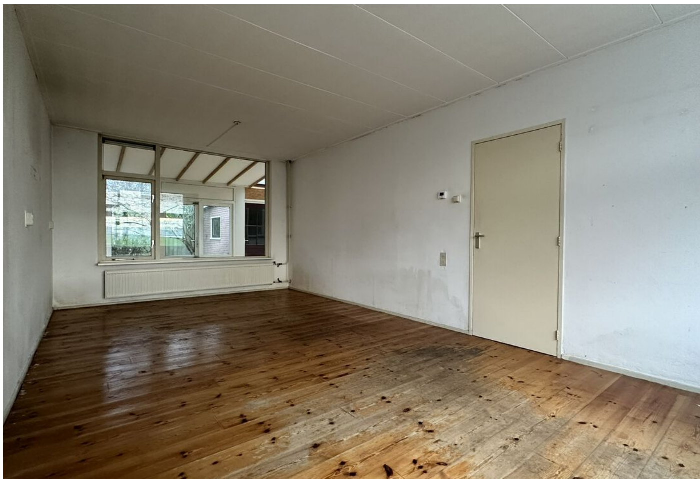
Tuinstraat 3, Hauwert