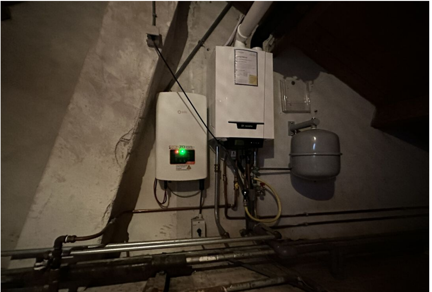
Tuinstraat 3, Hauwert