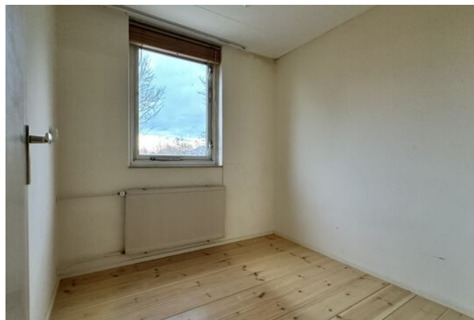
Tuinstraat 3, Hauwert