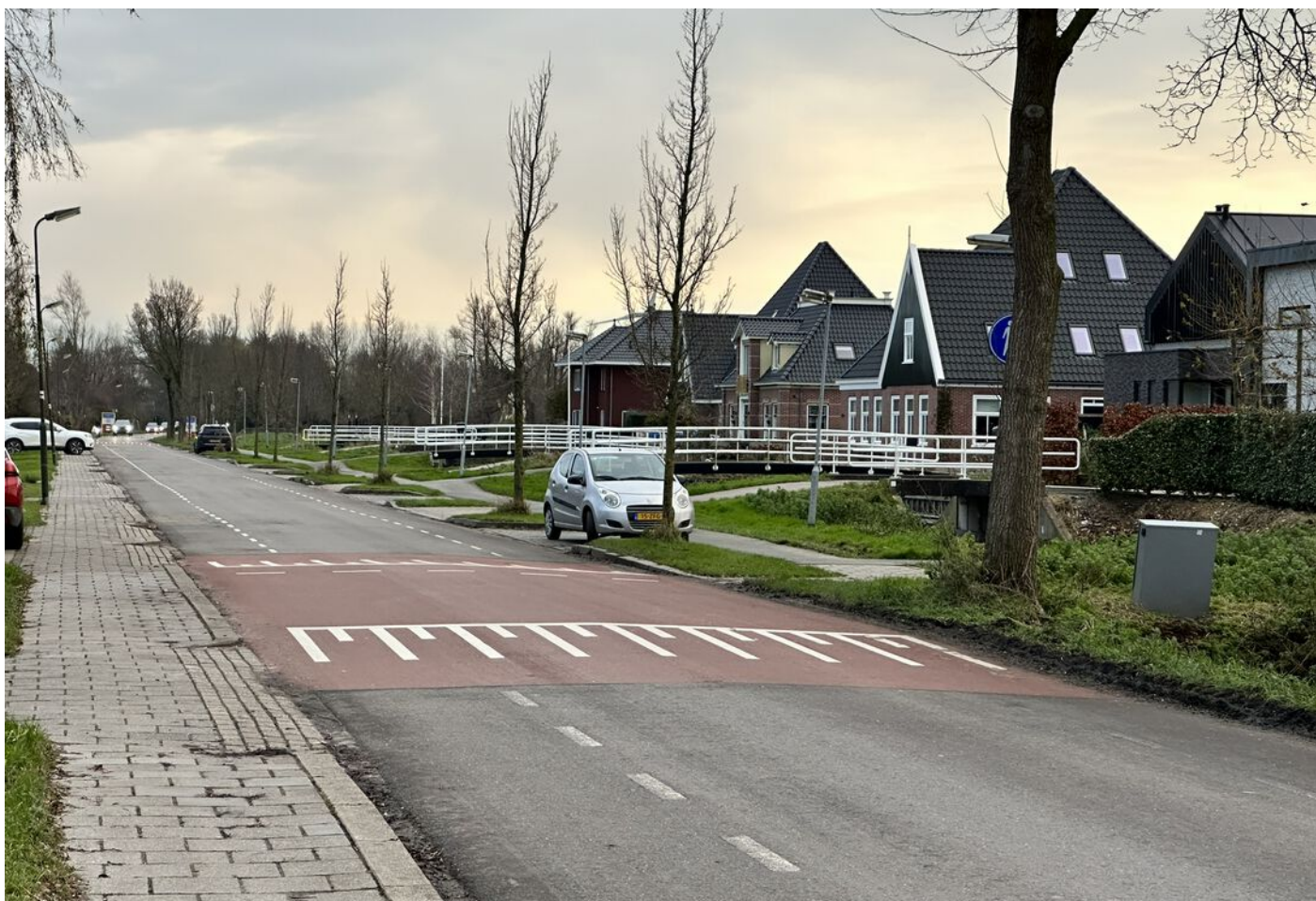
Tuinstraat 3, Hauwert