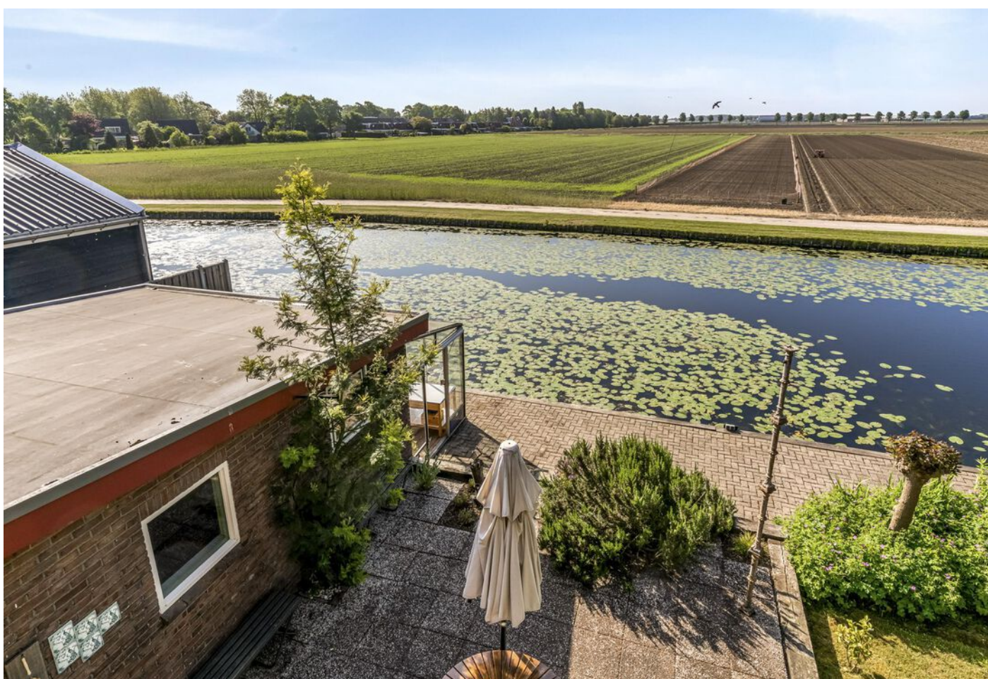
Kleingouw 42, Andijk