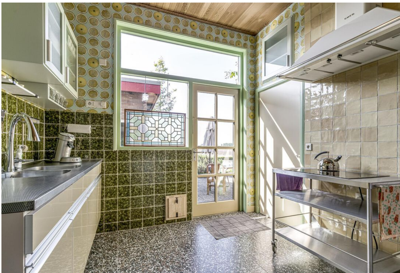
Kleingouw 42, Andijk