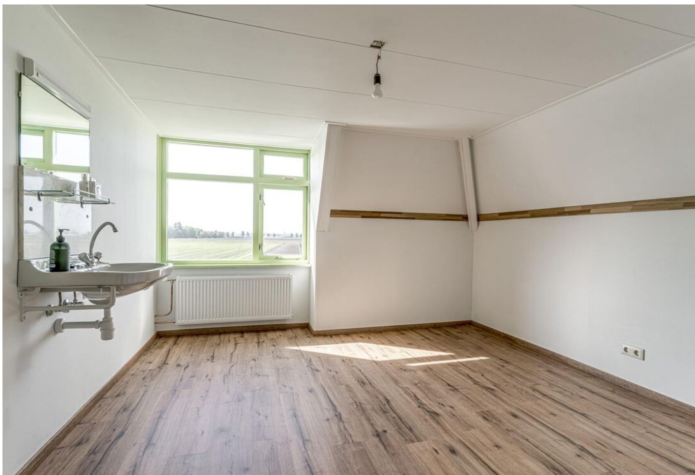
Kleingouw 42, Andijk