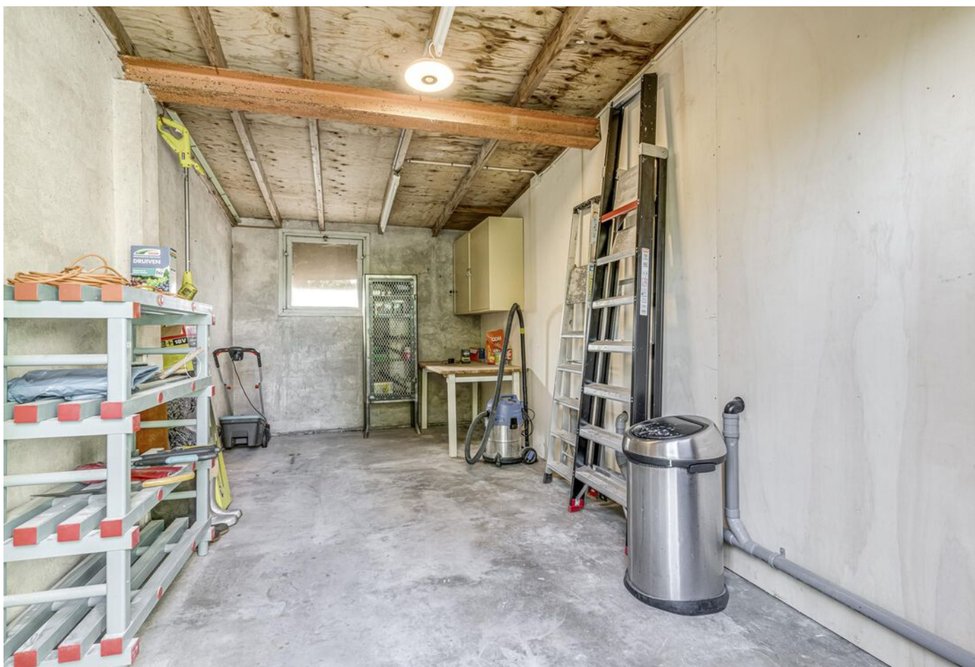
Kleingouw 42, Andijk