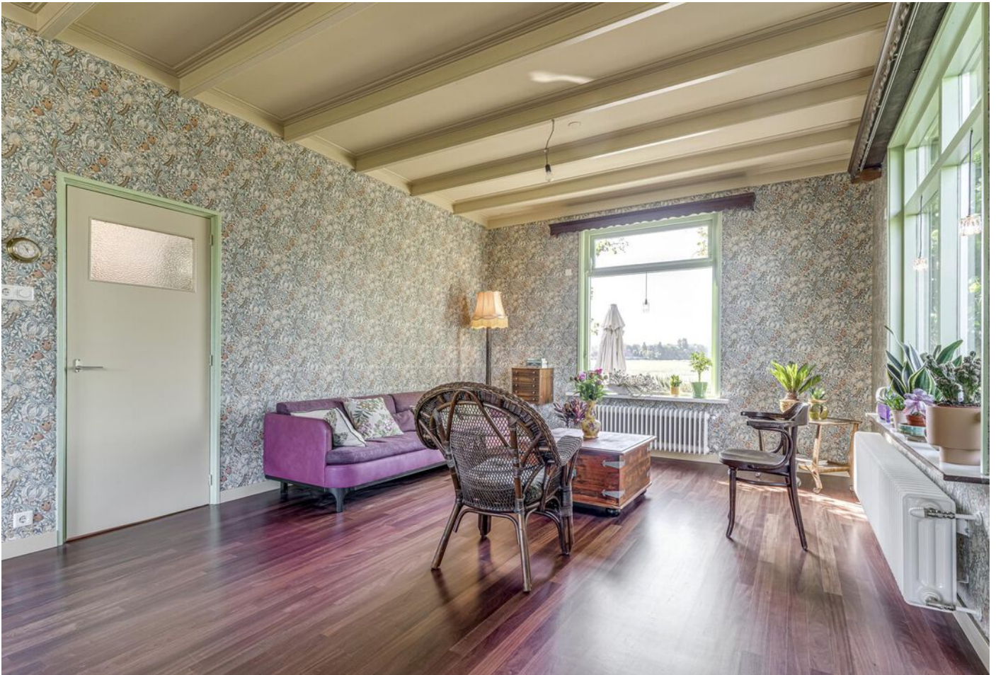
Kleingouw 42, Andijk