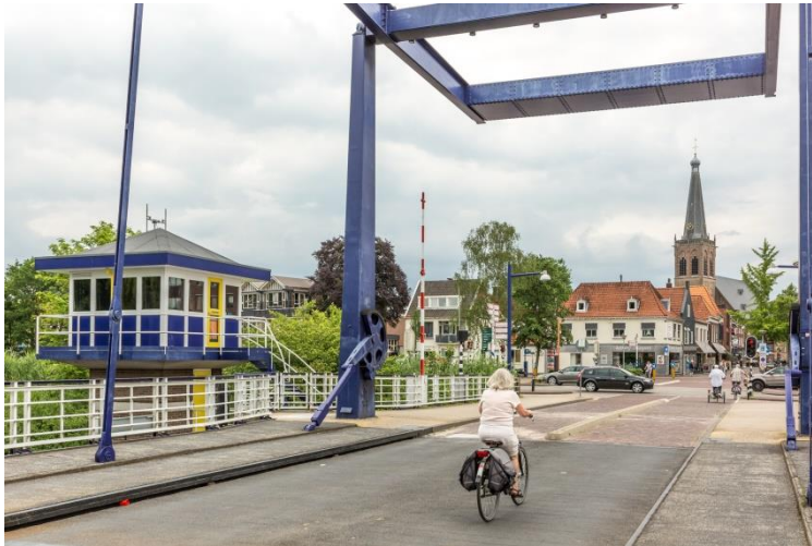
In Doetinchem is het goed wonen, werken en recreëren

De stad Doetinchem vervult een regiofunctie in de Achterhoek. Samen met de dorpen Gaanderen, Wehl, Nieuw-Wehl, Wijnbergen en buurtschappen wordt de gemeente Doetinchem gevormd, ook wel geschreven en uitgesproken als Deutekom . Met ruim 57.000 inwoners (Bron: CBS, april 2017) en een oppervlakte van ruim 79 km 2 waarvan 0,57 km 2 water, is Doetinchem de dichtstbevolkte gemeente van de Achterhoek. Binnen de gemeente is het mogelijk om zowel stedelijk als landelijk te wonen.