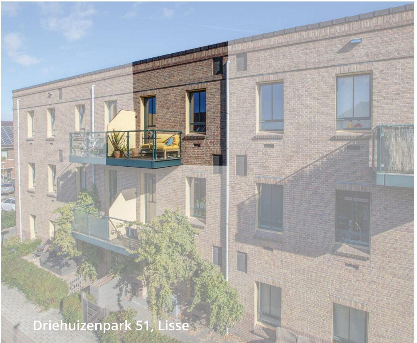
Driehuizenpark 51, Lisse