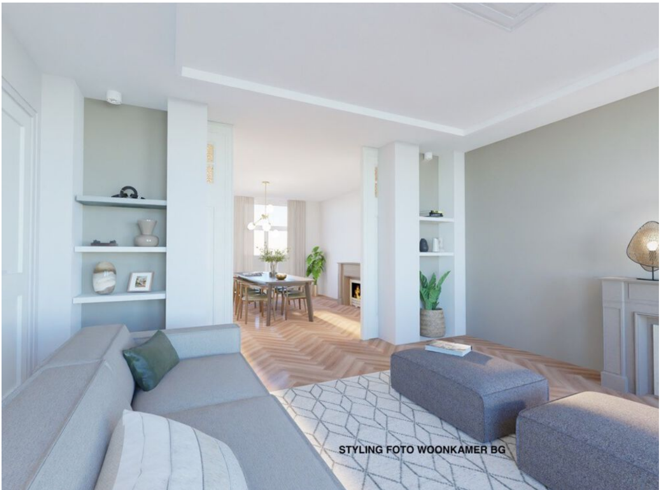
STYLING FOTO WOONKAMER BG