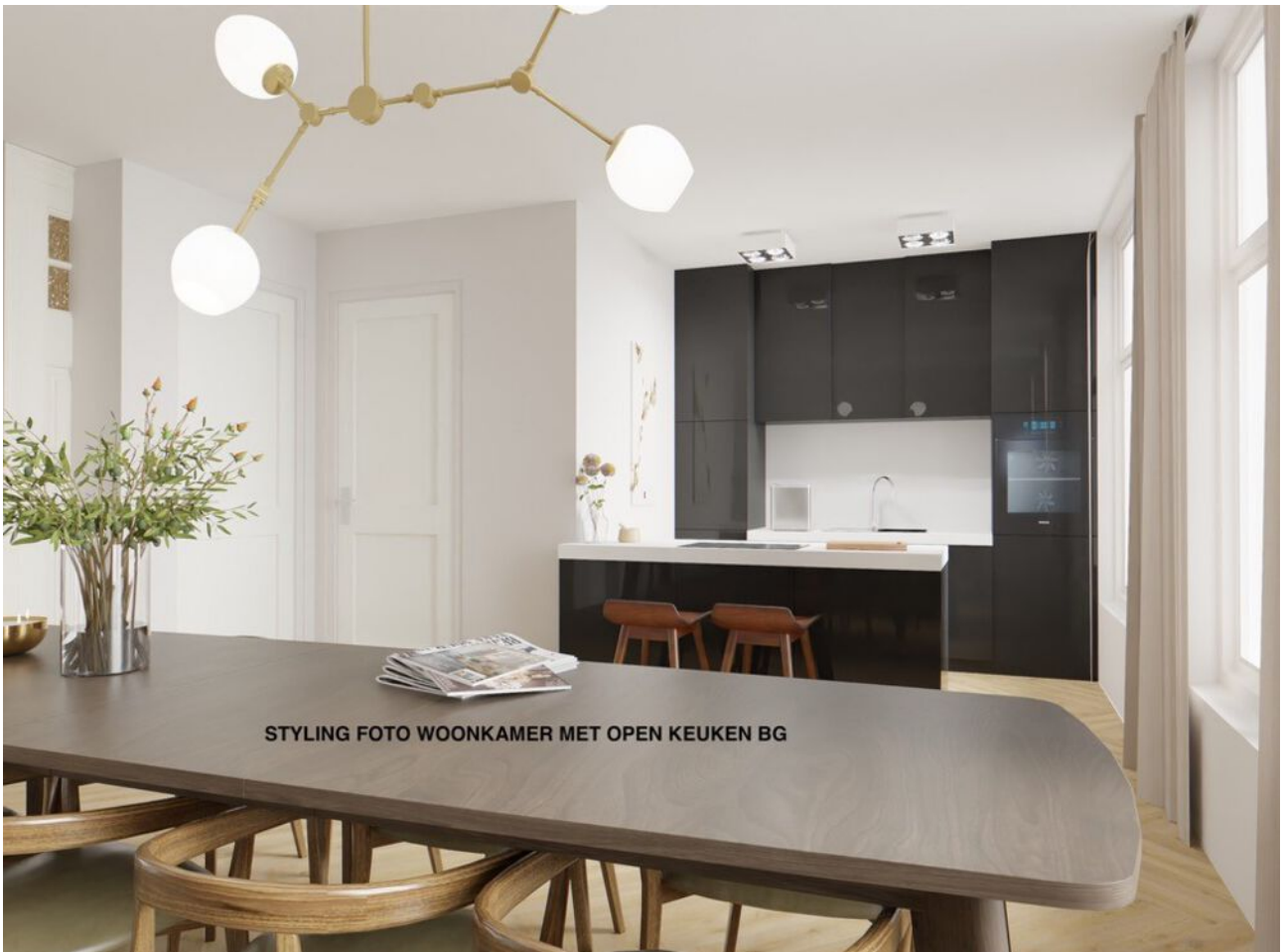
STYLING FOTO WOONKAMER MET OPEN KEUKEN BG