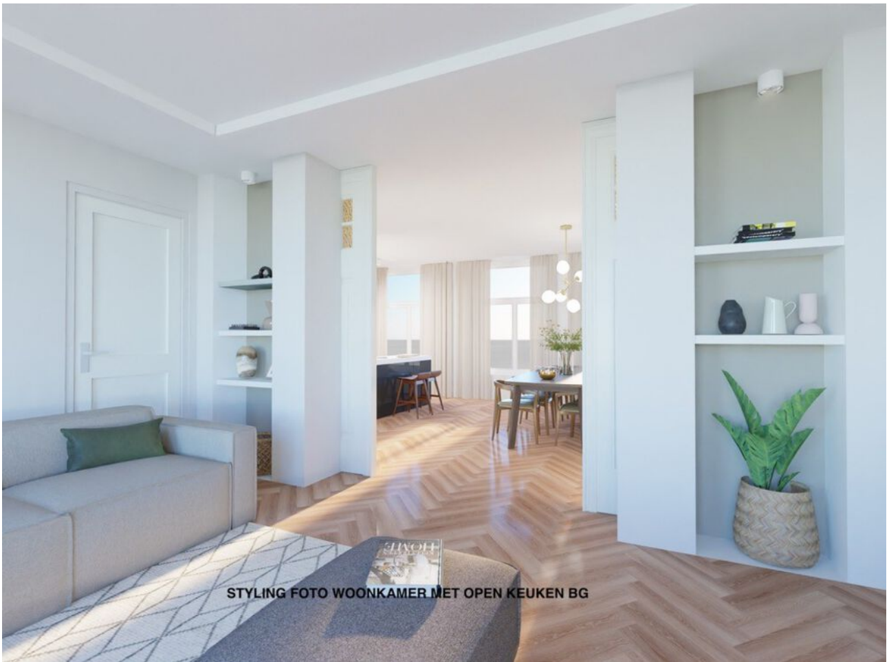
STYLING FOTO WOONKAMER MET OPEN KEUKEN BG