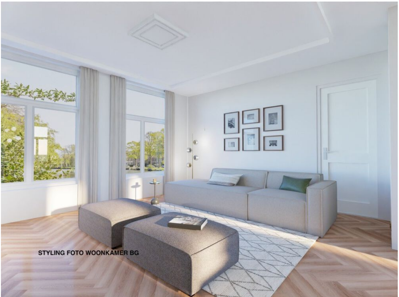
STYLING FOTO WOONKAMER BG