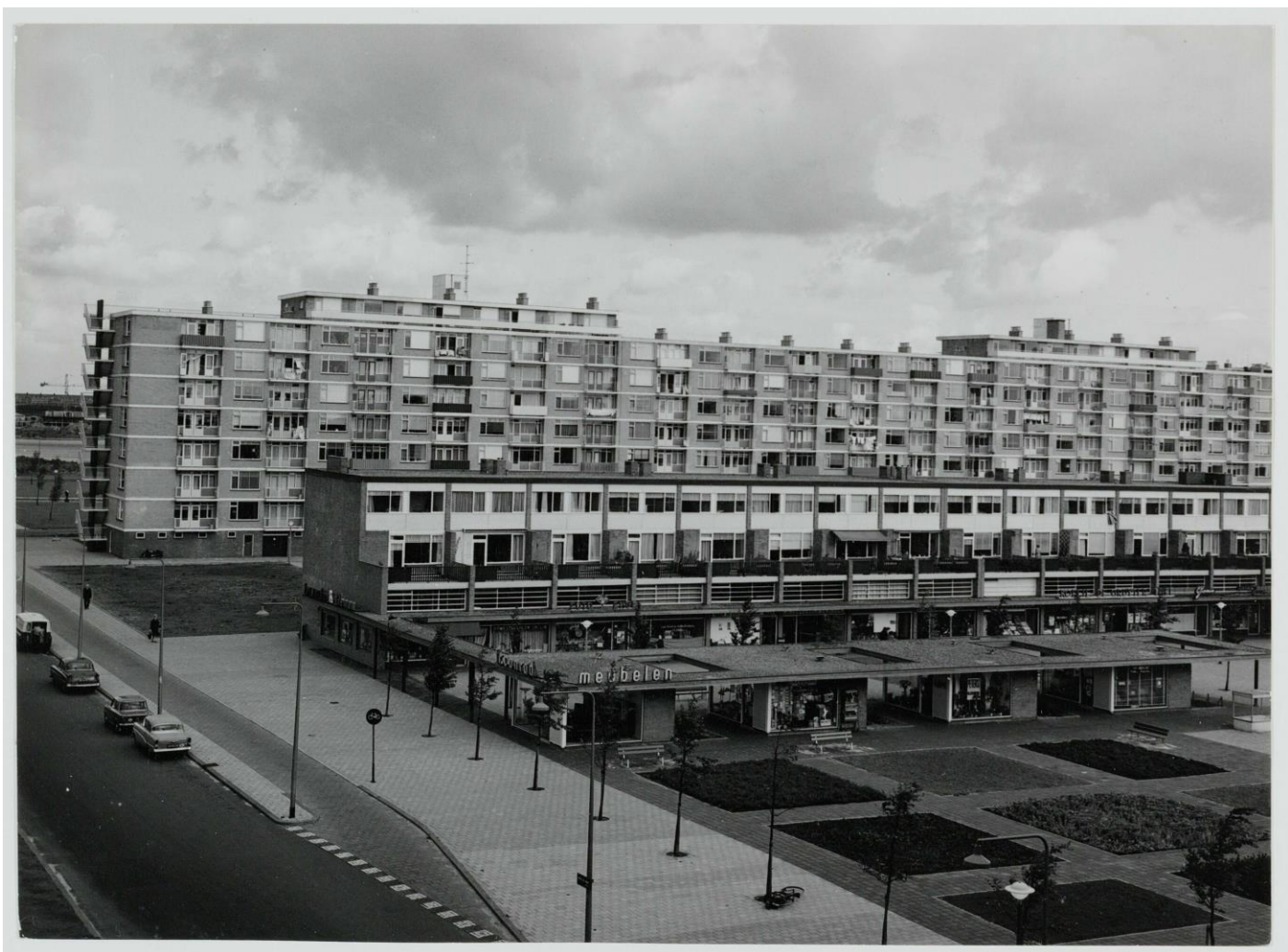
Archief foto uit 1965

Een overeenkomst komt pas tot stand na uitdrukkelijke en schriftelijke overeenstemming van de eigenaar.