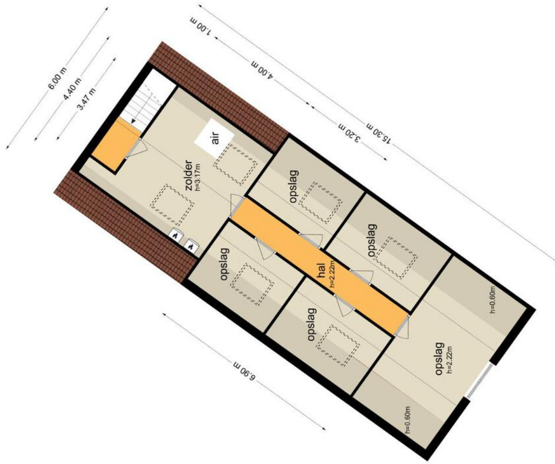
Oud Milligenseweg 7 - Garderen Eerste Verdieping