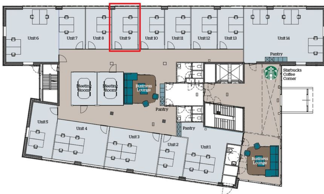
Plattegrond begane grond BusinessCenter Spoetnik, Spoetnik 10-60, Amersfoort